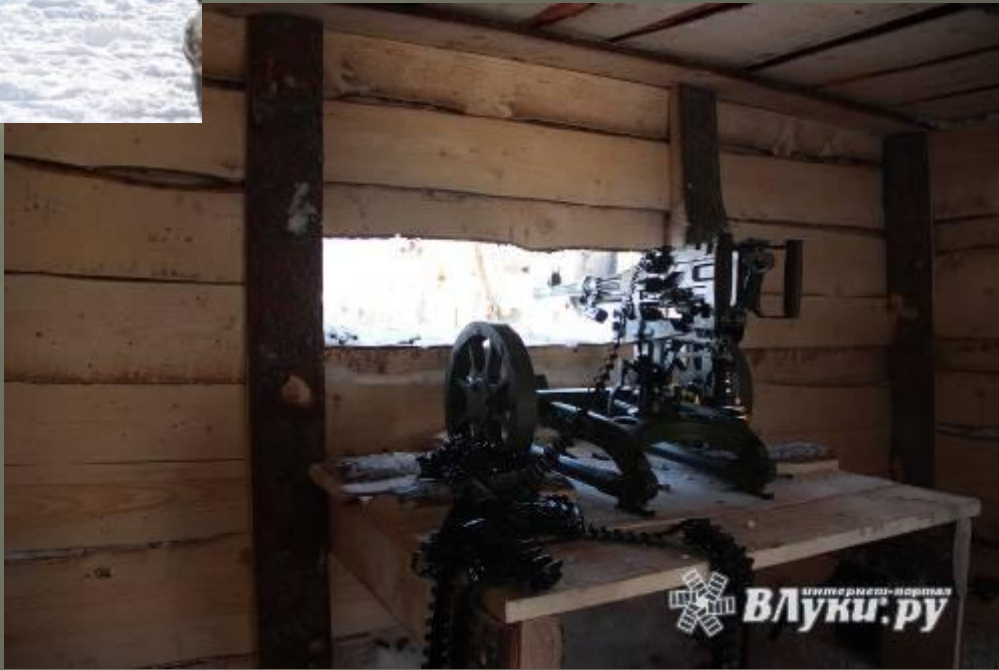
Реконструкция боя, 23 февраля 2018г., Великие Луки