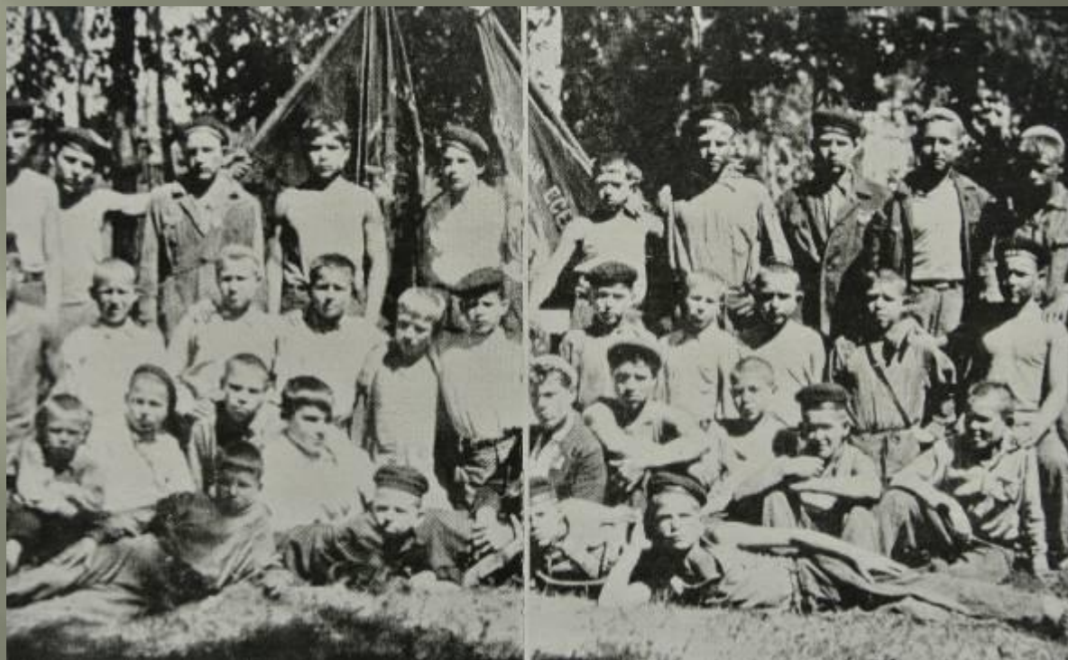
Пионерский отряд воспитанников Ивановского детского дома (в центре А.Матросов)

Родился 5 февраля 1924 года в городе Екатеринославе (ныне Днепропетровск). Рано лишился родителей. 5 лет воспитывался в Ивановском детском доме (Ульяновская область). Затем воспитывался в Уфимской детской трудовой колонии.