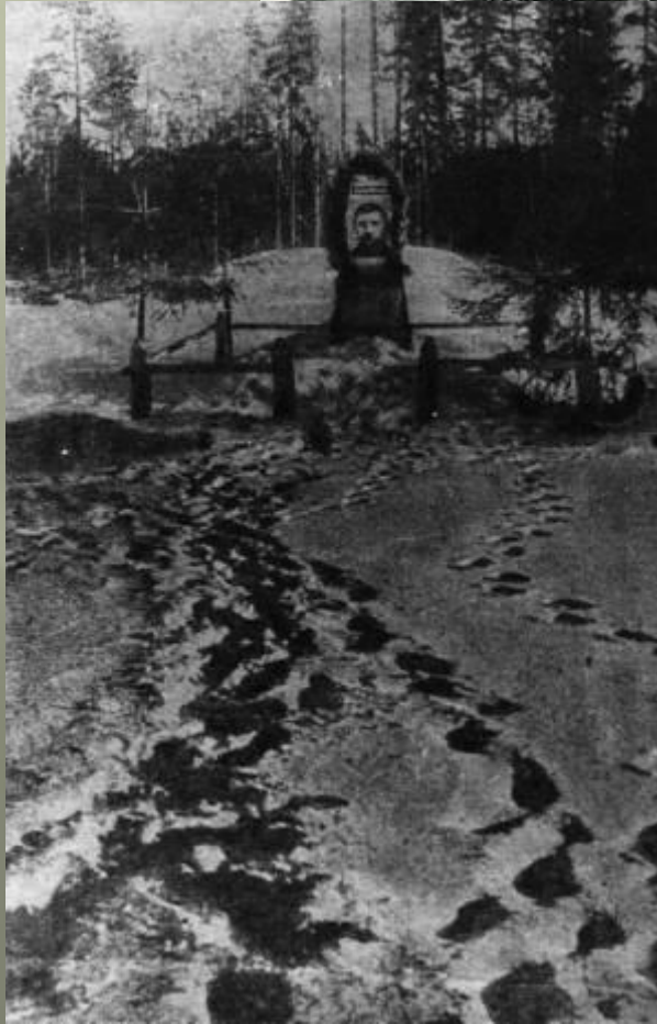
Первая могила А. Матросова, деревня Чернушки

Города Матросова так на карте и не появилось. Впрочем, жизнь не стоит на месте, все еще может быть.