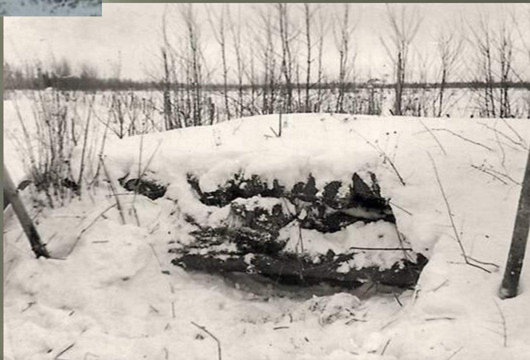
Тот самый дзот, который обезвредил Матросов, 1943 г.