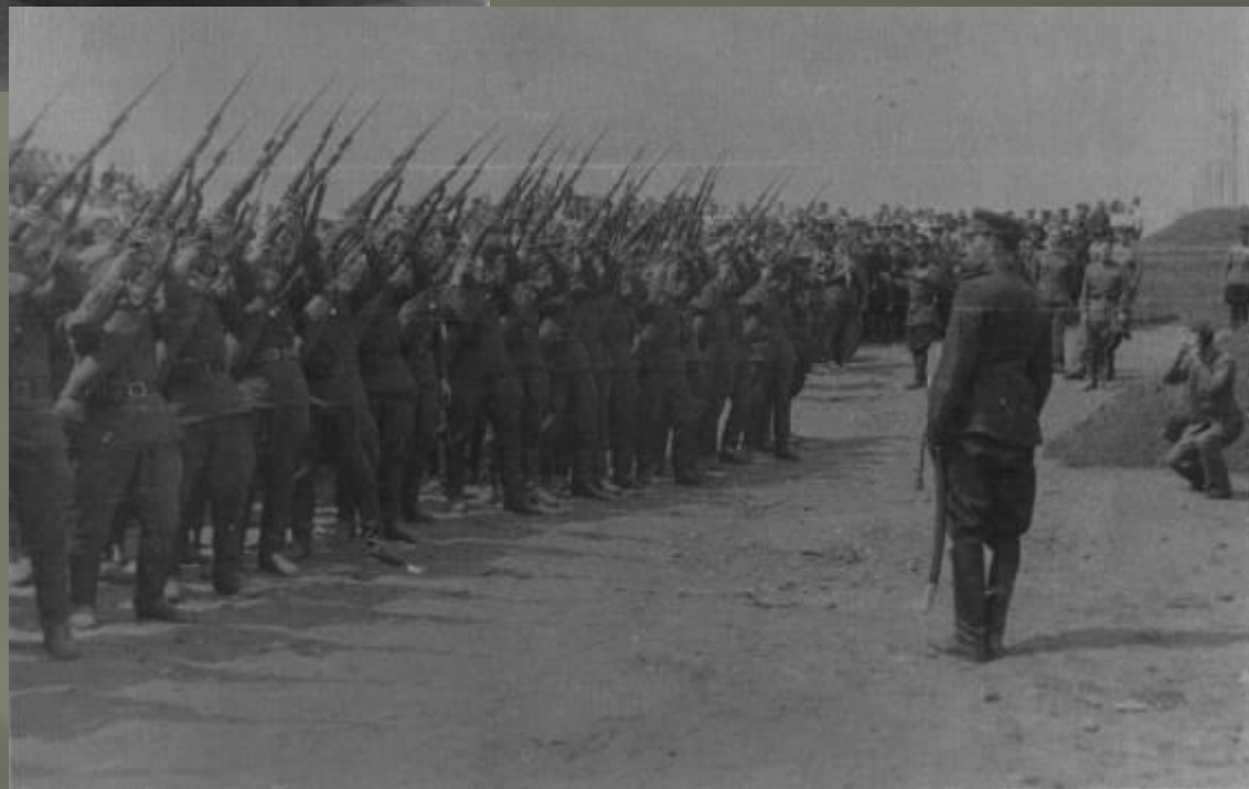
Перезахоронение А. Матросова в Великих Луках 1948 г.