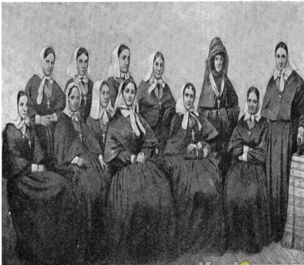
Группа сестер милосердия Крестовоздвиженской общины, участвовавших в обороне Севастополя.