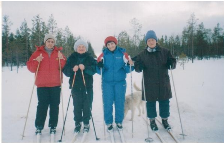
Поход на лыжах в зимний лес