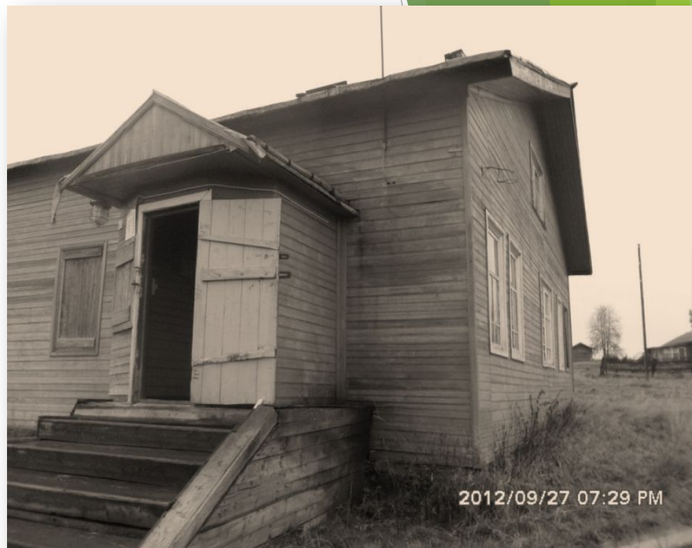
Здание бывшего нардома.

Там же находилась партячейка. Здесь имелись небольшой фонд книг и сцена, где проводились собрания, выступали с концертами, постановками.