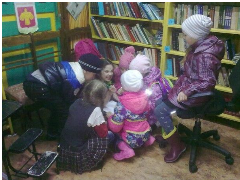
В библиотеке интересно всем.