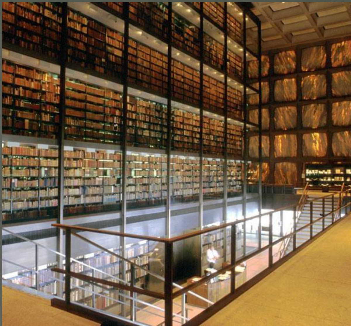
Библиотека Бейнеке редких книг и рукописей, Нью-Хейвен, Коннектикут, США