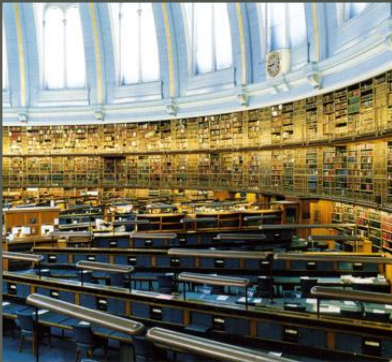
Старый читальный зал Британского музея, Лондон