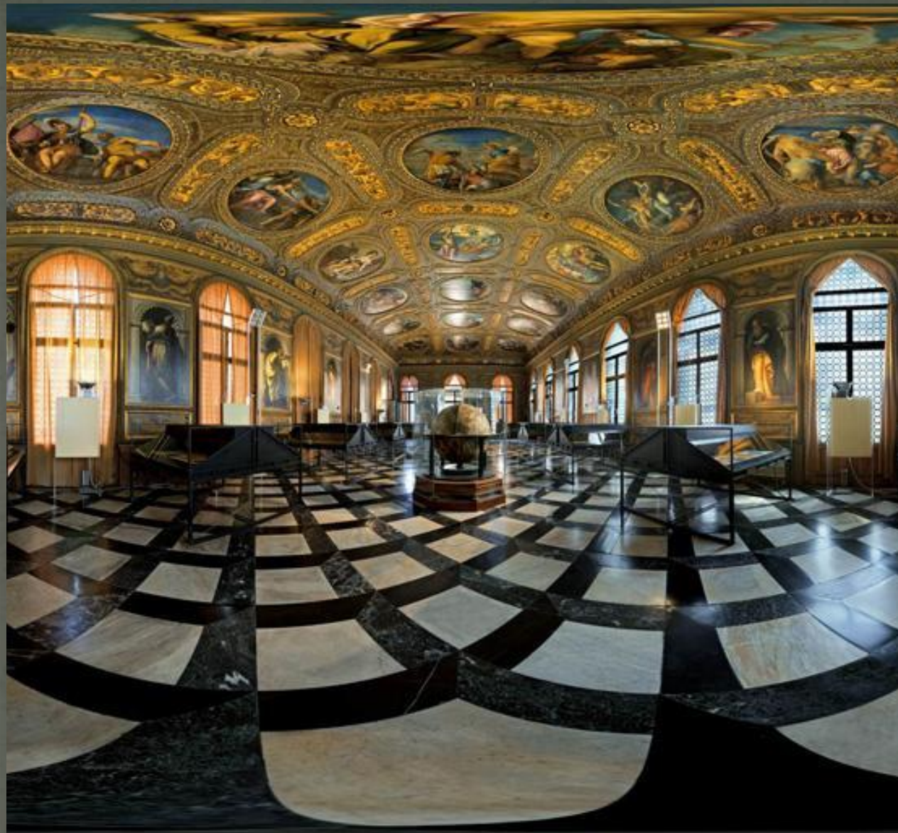
Библиотека Сансовино, Рим, Италия