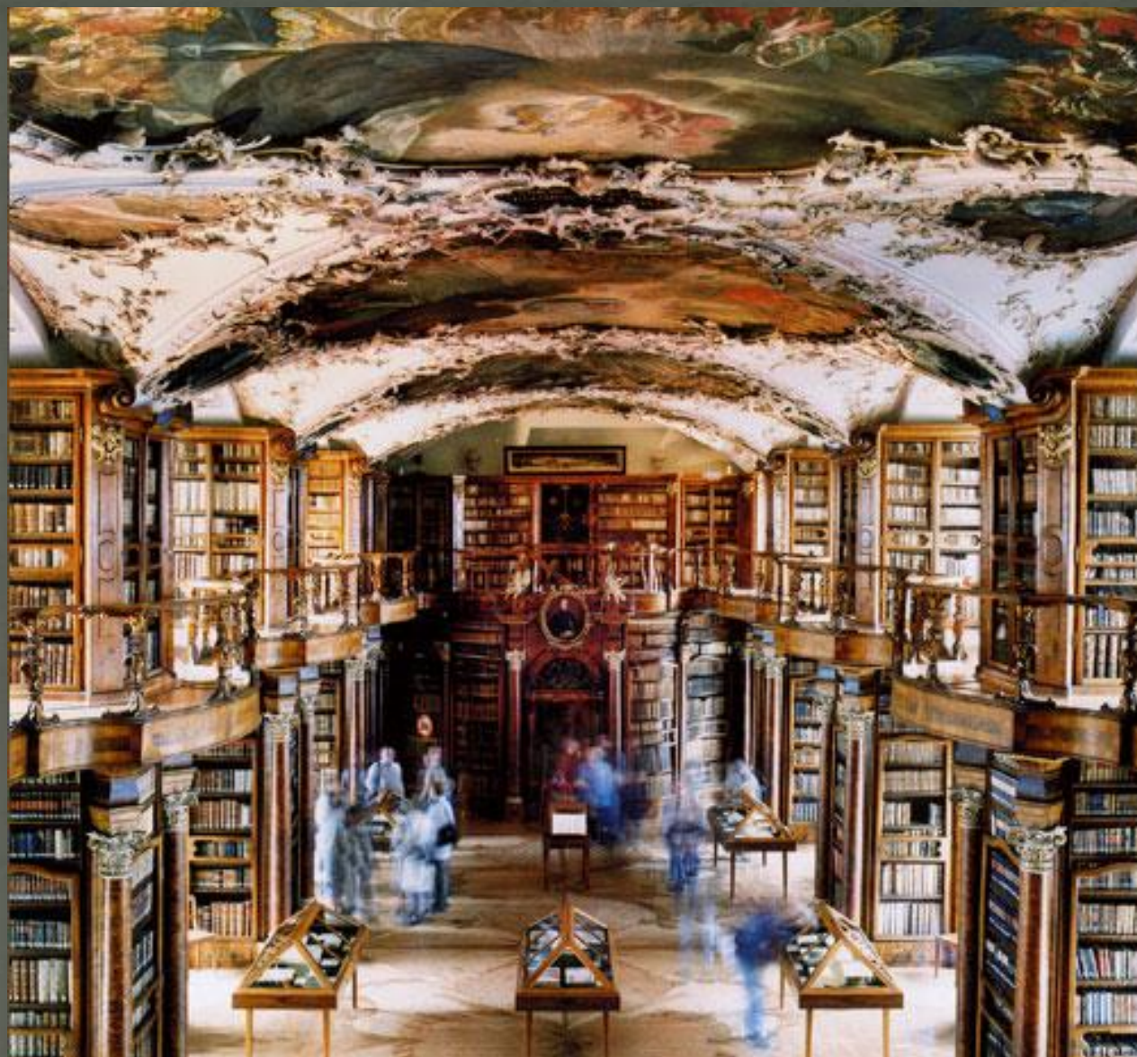
Библиотека аббатства Санкт-Галлена