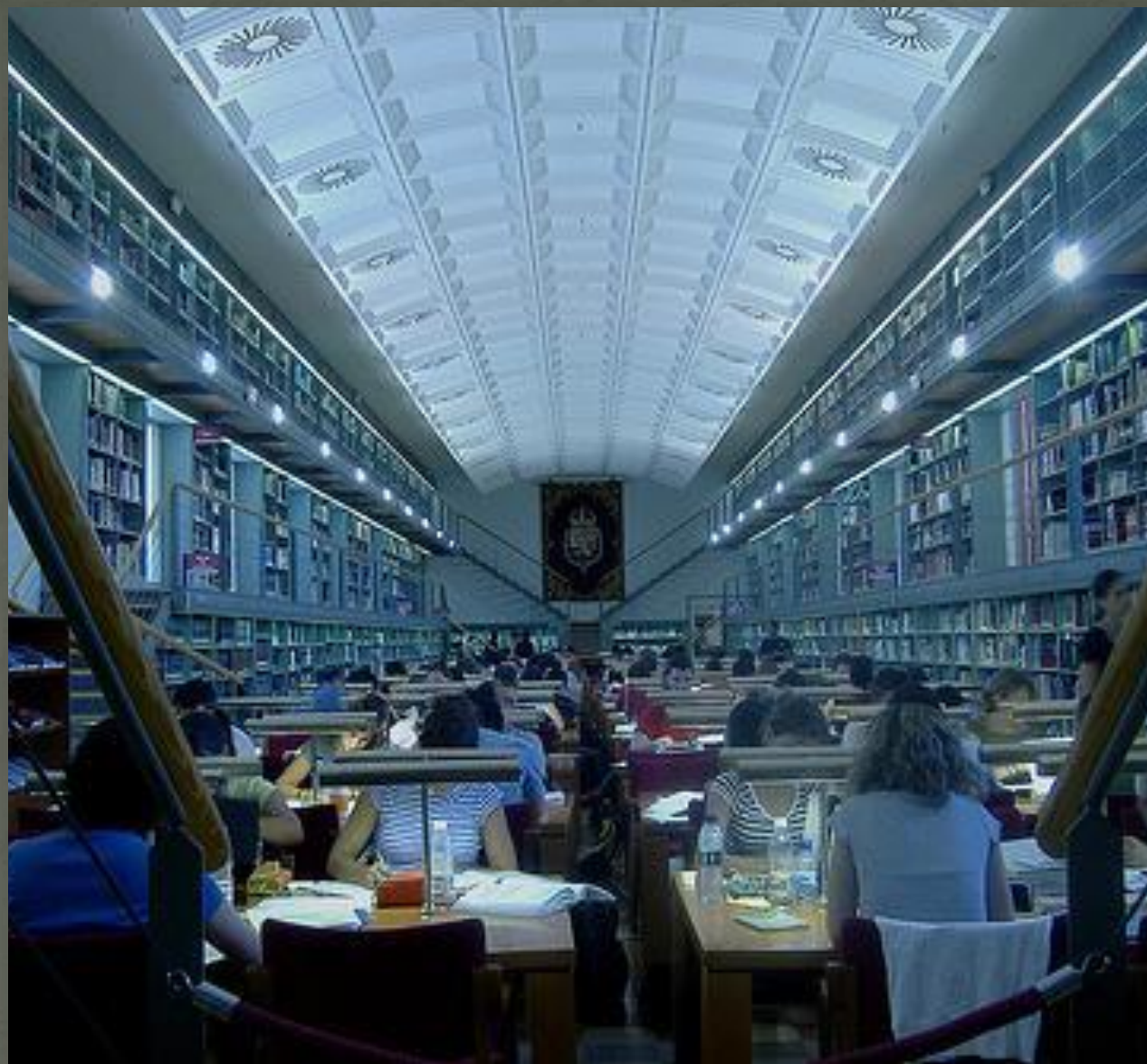
Библиотека Кастилии-ла-Манча, Испания