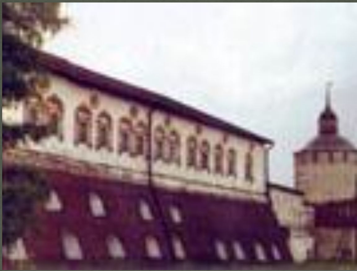
Здание библиотеки Кирилло- Белозерского монастыря 11век

500 томов – таким собранием в то время могли похвалиться не многие библиотеки Европы. Неизвестно, куда пропала библиотека Ярослава Мудрого: возможно, она погибла во время большого пожара 1124 г.