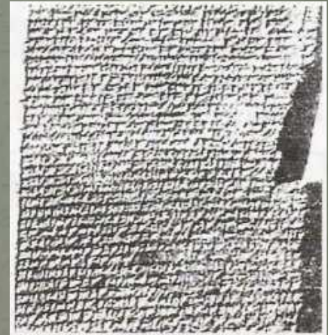
Клинописная таблица с мифом о потопе

Эта надпись была скреплена царской печатью.