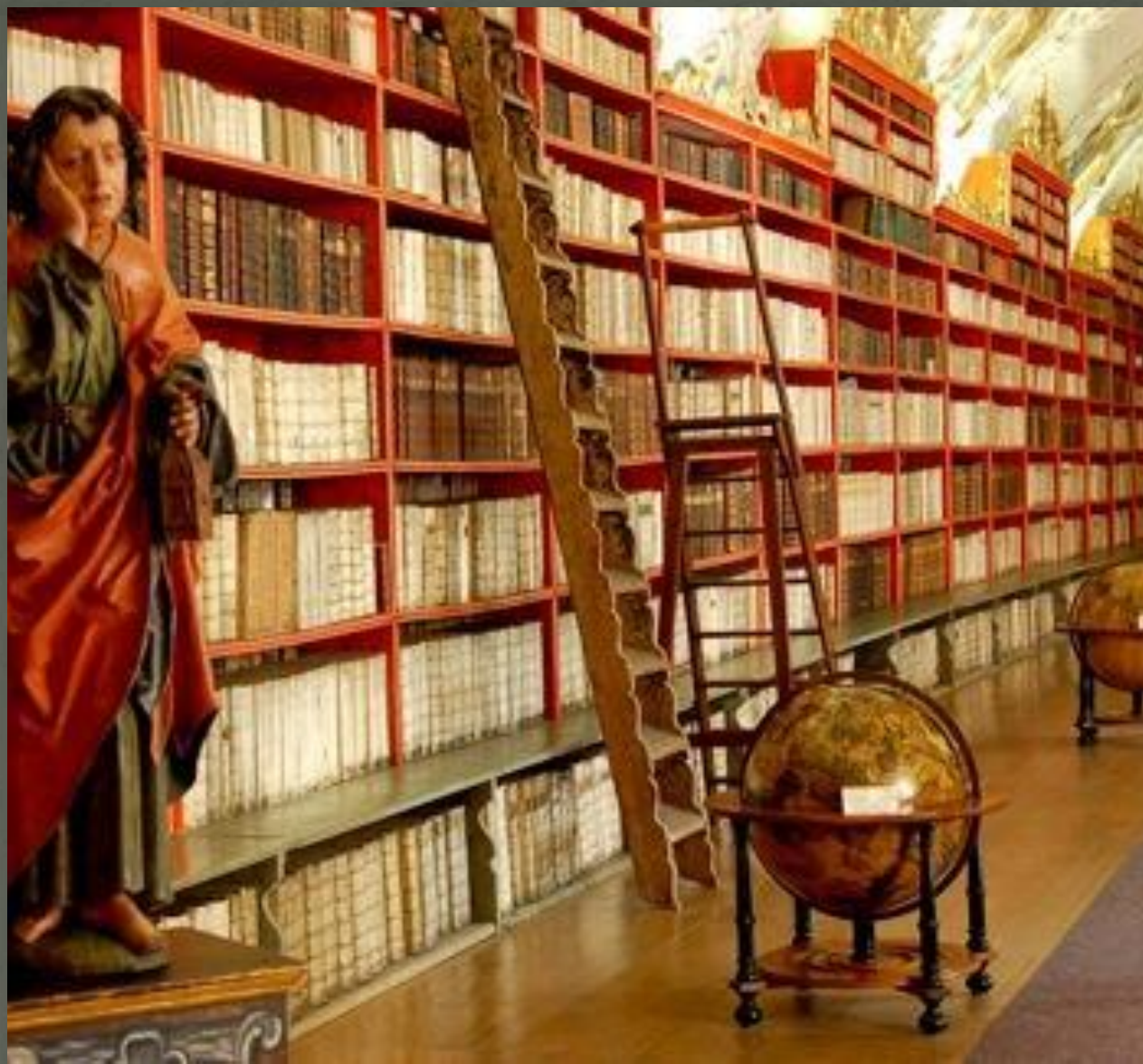
Библиотека Страховского монастыря, богословский зал. Статуя проповедника Иоанна, держащего книгу.