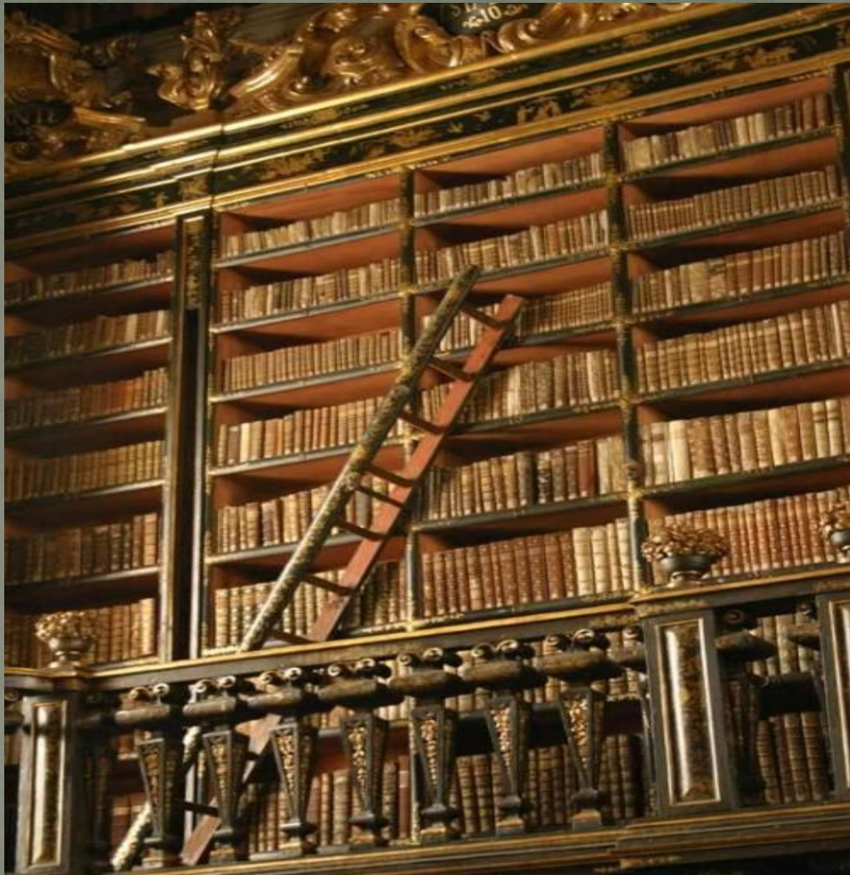
Библиотека университета Коимбра, Португалия