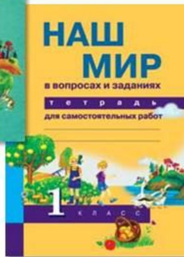
Тетрадь для самостоятельных работ