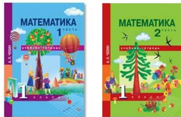
Учебник в двух частях