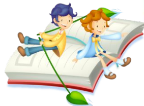
Прописи № 1, 2, 3