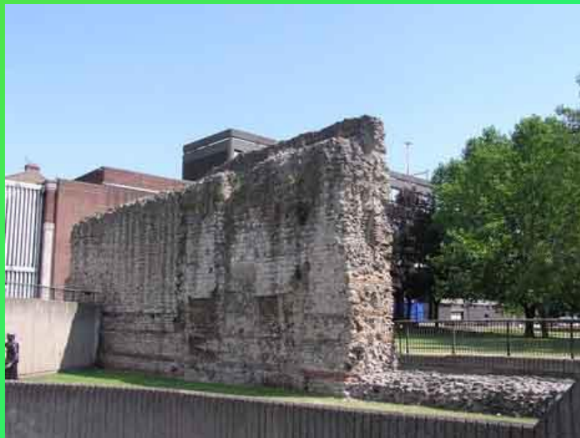
Остатки римской городской стены