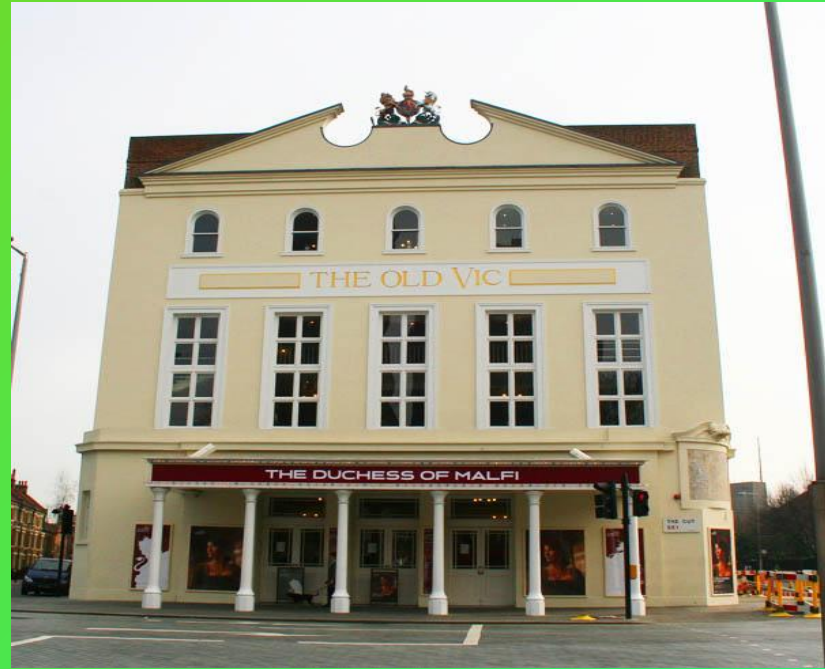
Театр королевы Виктории (Old Vic)