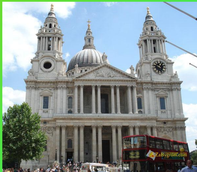
Собор Святого Павла

Территория Сити занимает одну квадратную милю, здесь проживают немногим больше тысячи человек.