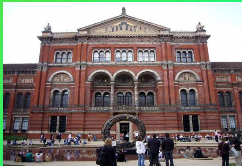
Музей Виктории и Альберта