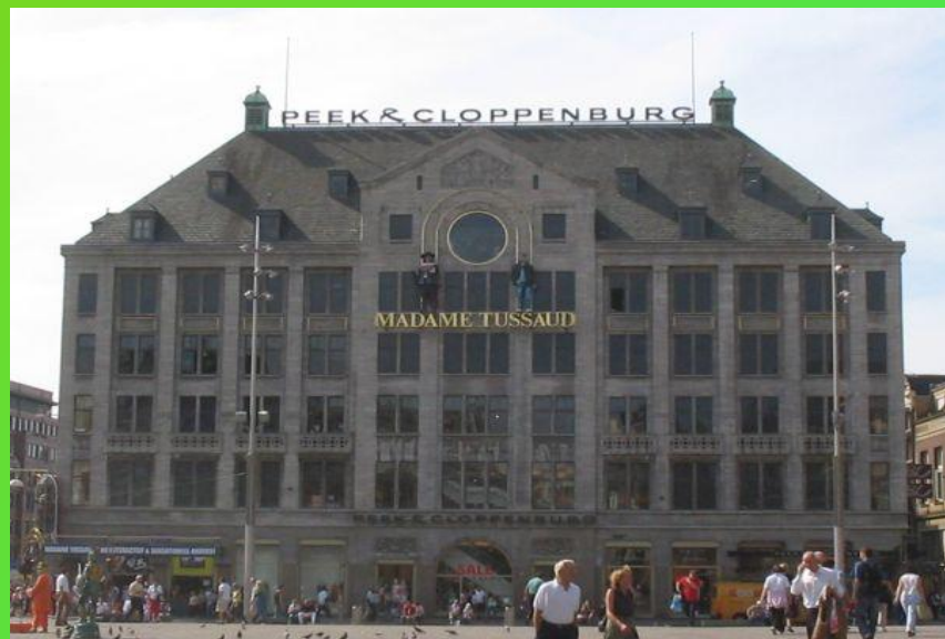
Музей восковых фигур мадам Тюссо