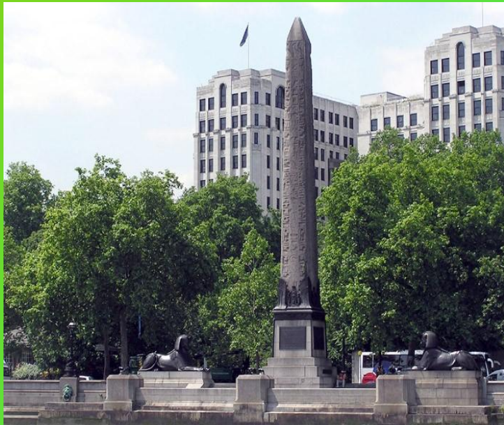
Игла Клеопатры(ее высота 20,87 м и вес около 187 тонн.)