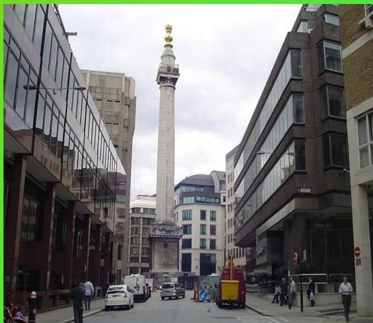
Памятник Великому лондонскому пожару 1666 г.