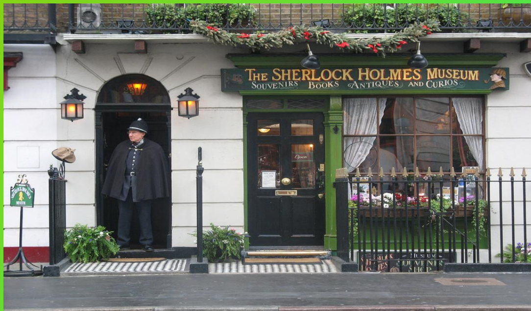
Музей Шерлока Холмса