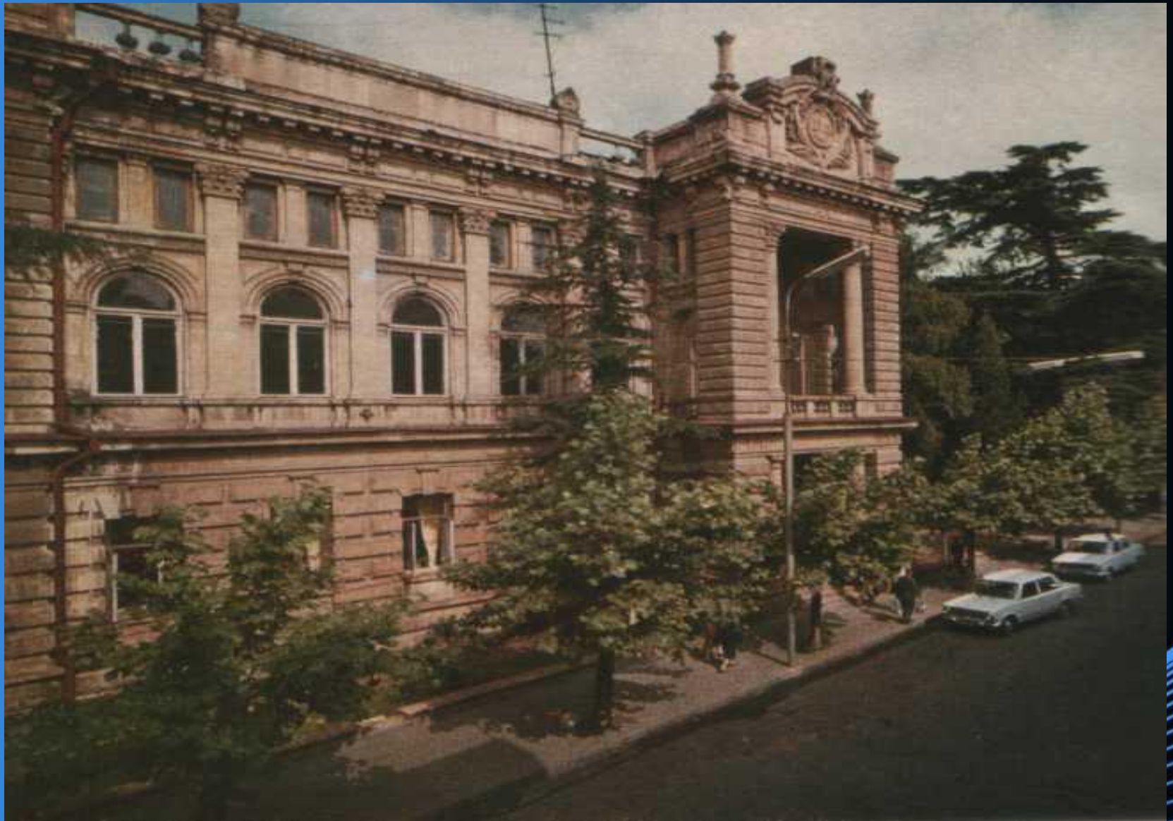
Кутаисская гимназия (1902 год)