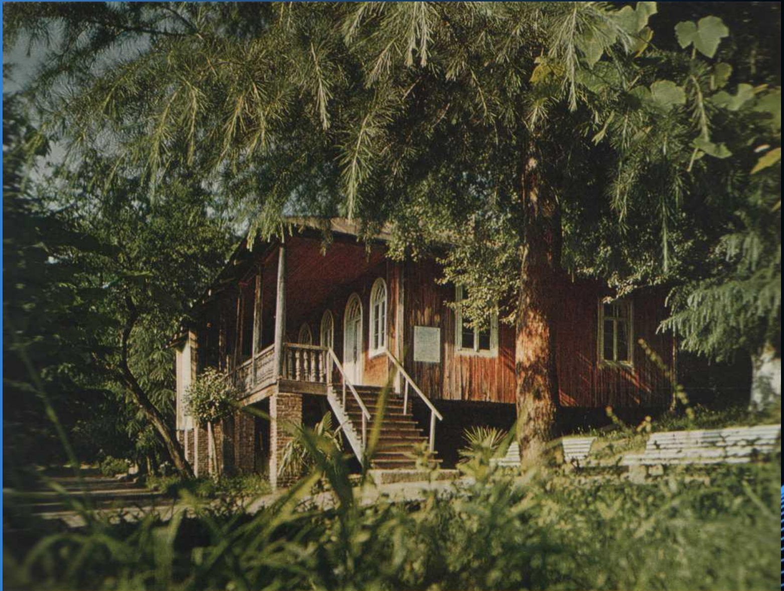
Дом, где родился В. В. Маяковский