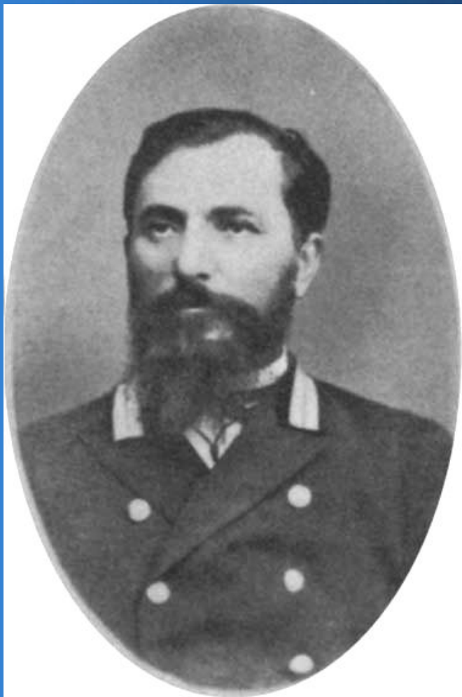
Владимир Константинович Маяковский