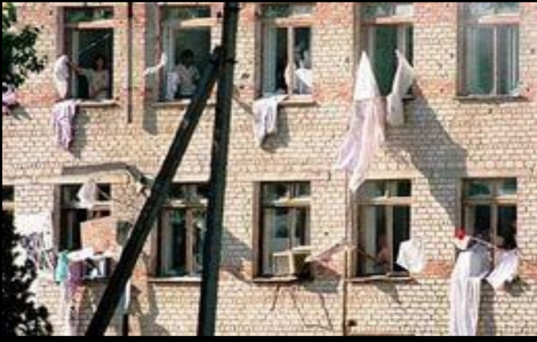
Больница в Буденновске