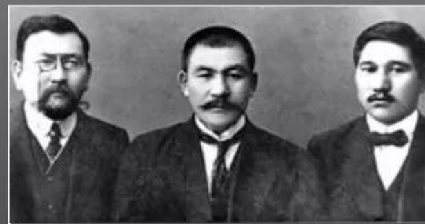
Руководители партии «Алаш» А. Байтурсьнов, А. Букейханов и М. Дулагов