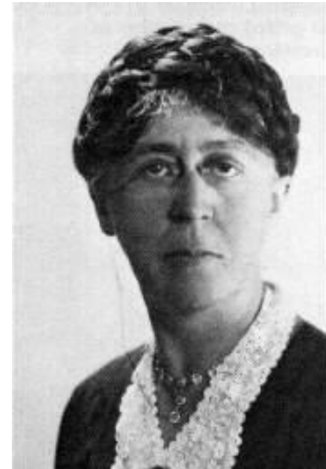
Mary Parker Follett (1868-1933)