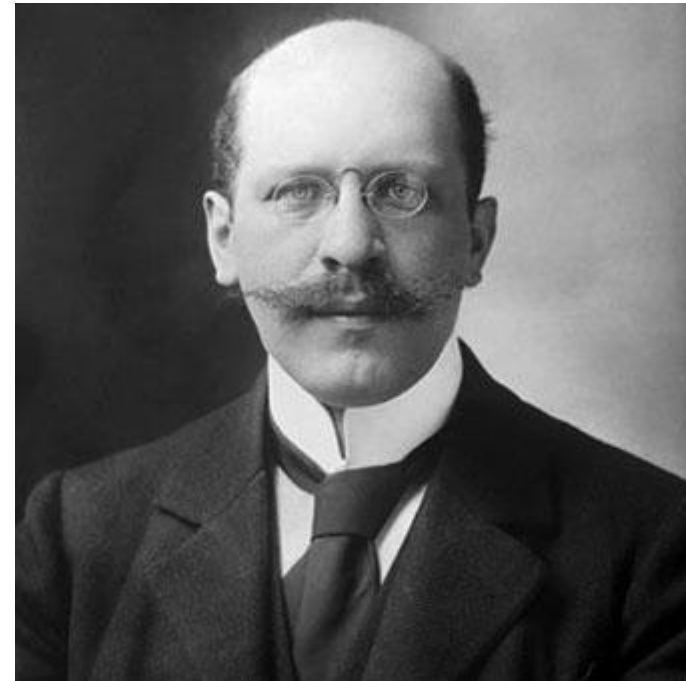
Hugo Münsterberg (1863-1916)