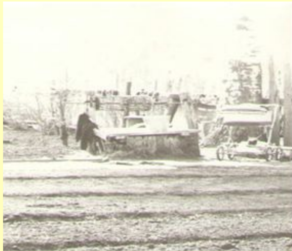
Колодец в начале двадцатого века