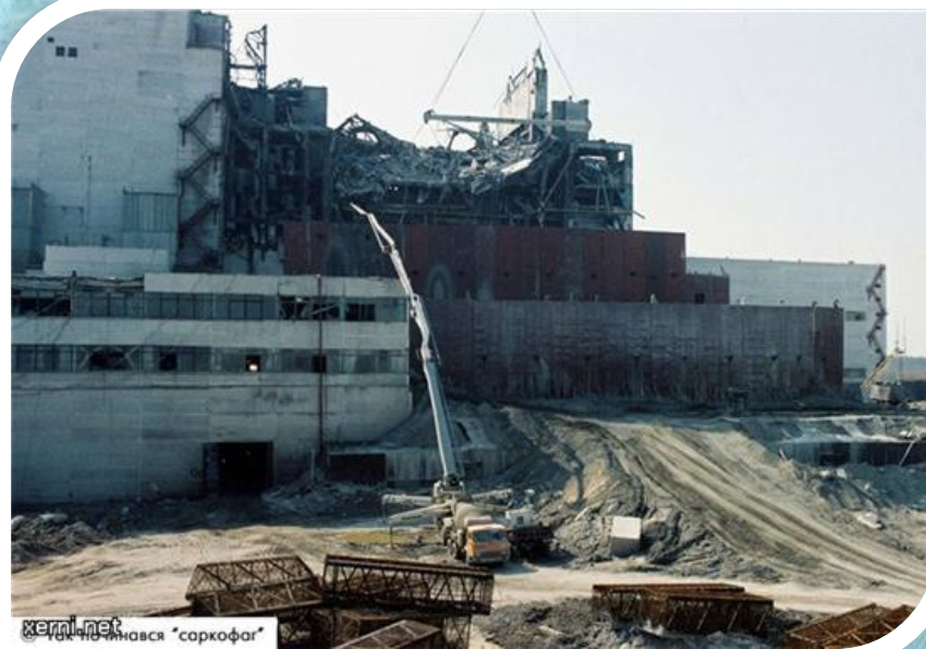
Именно так назывался "саркофаг"