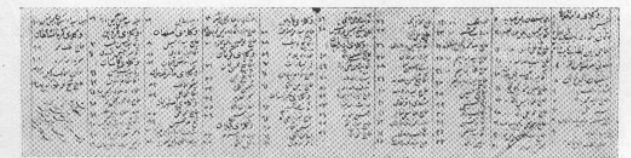
Members of the First Majlis (Oct. 7, 1906—June 23, 1908)