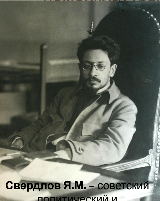
Свердлов Я.М. – советский политический и государственный деятель, революционер, большевик.

XX в. – советский период, революционное новаторство и преемственность в организации гос. службы, складывание советской номенклатуры