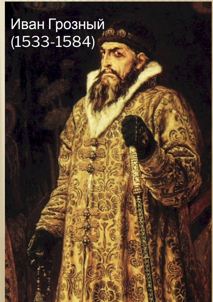
Иван Грозный (1533-1584)