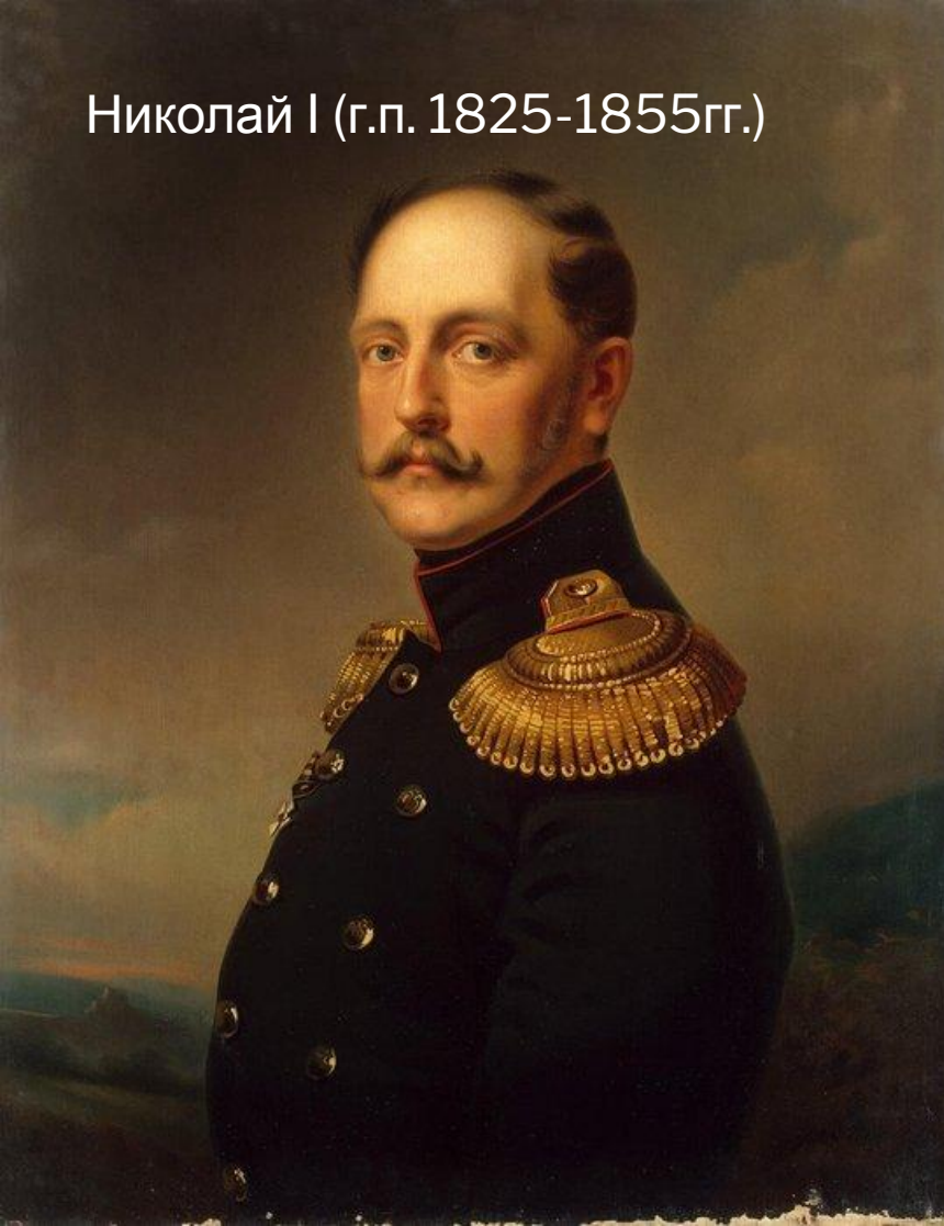
Николай I (г.п. 1825-1855гг.)

Важным шагом в организации государственной службы стали: