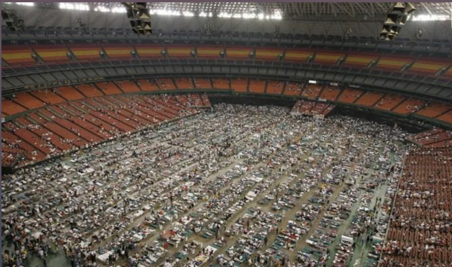
Стадион Superdome («Суперкупол») в Новом Орлеане