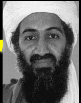
Usama bin Laden