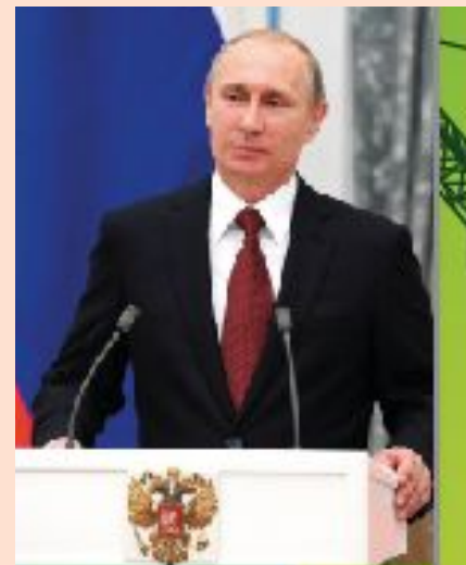
Президент России В.В.Путин

«Трудом и талантом многих поколений инженеров, проектировщиков, рабочих, специалистов в нашей стране были возведены города и посёлки, создана энергетическая, социальная, транспортная инфраструктура, введены в строй крупнейшие производственные комплексы» -