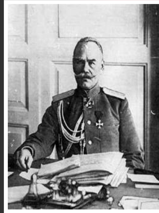
Верховный руководитель Добровольческой армии А.В.Алексеев

Дальний Восток: высадка американских и японских войск.