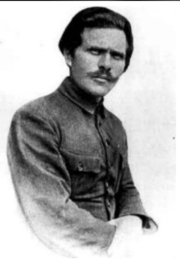
Нестор Махно (1888 -1934 г.г.)

Украина – отряды «батьки Махно» Н.И.Махно – в юности увлёкся идеями анархизма, после революции в Гуляй-Поле (Украина) крестьяне под его руководством провели «чёрный передел» земли.