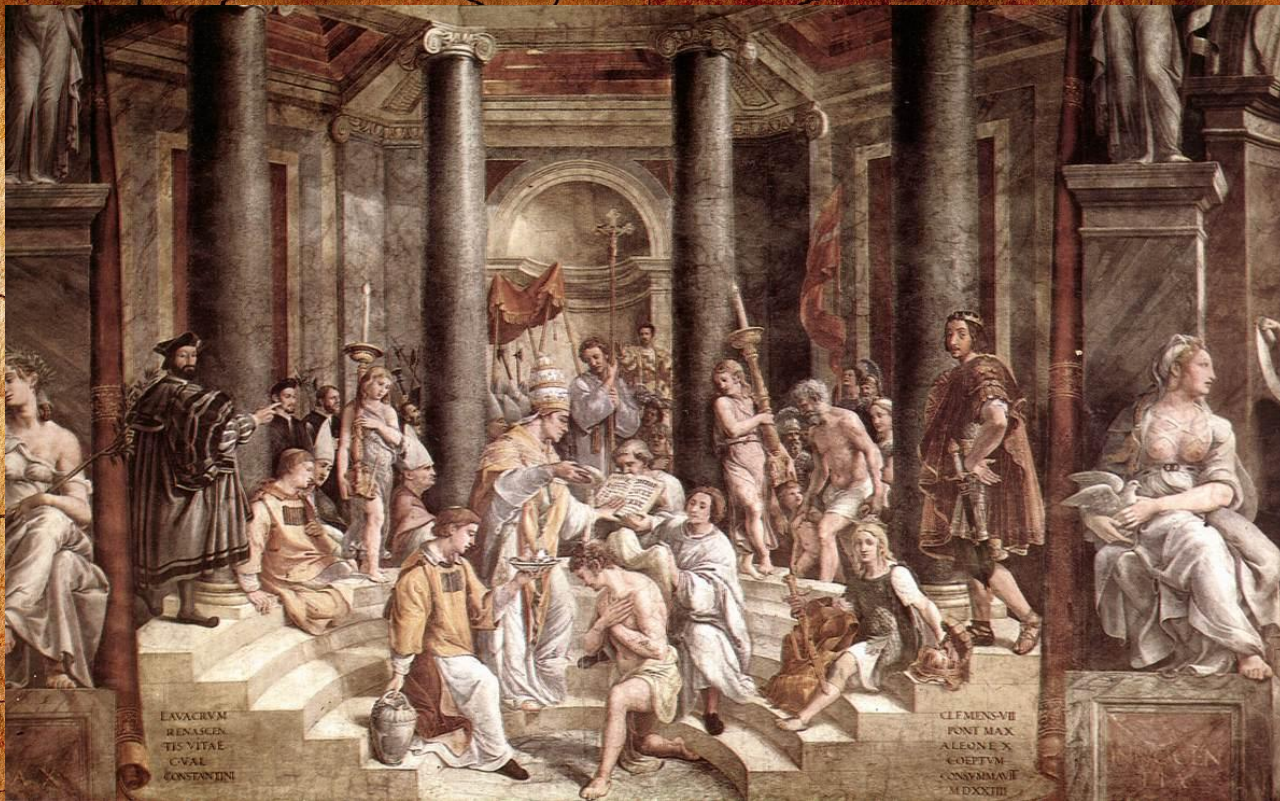
კონსტანტინეს ნათლობა. რაფაელ სანტი.ვატიკანი