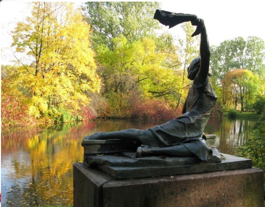
Памятник З. Портновой в Витебске