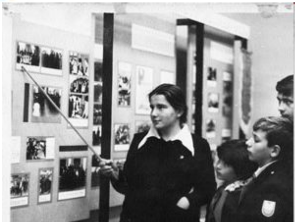
Музей В. Дубинина в школе № 1 г. Керчи