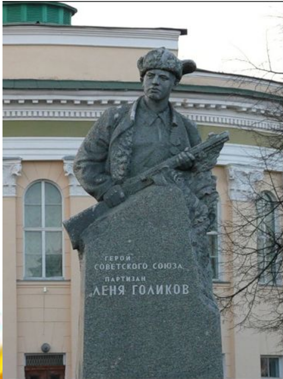
Памятник Лёне Голикову в Великом Новгороде