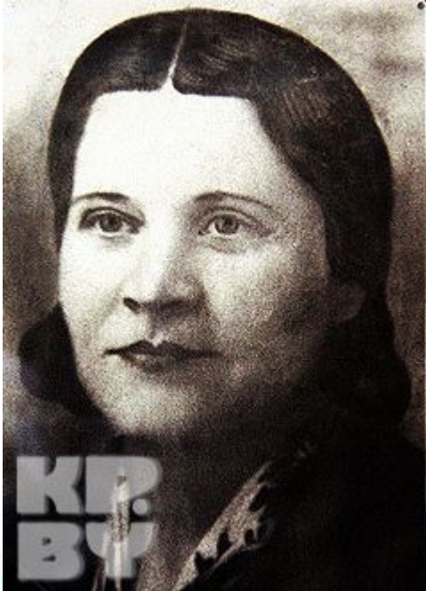
Мать М. Казея