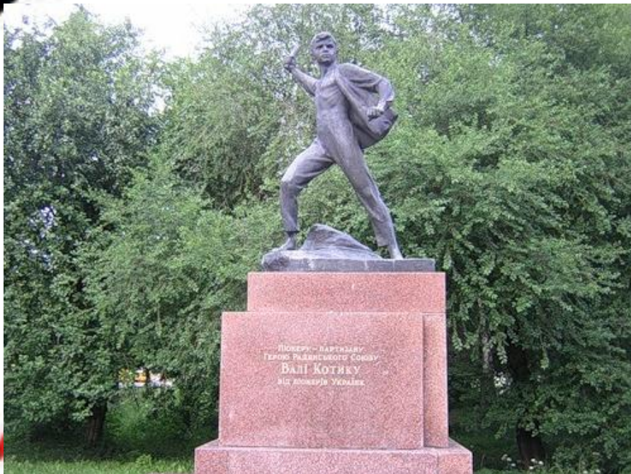
Памятник Вале Котику в Шепетовке