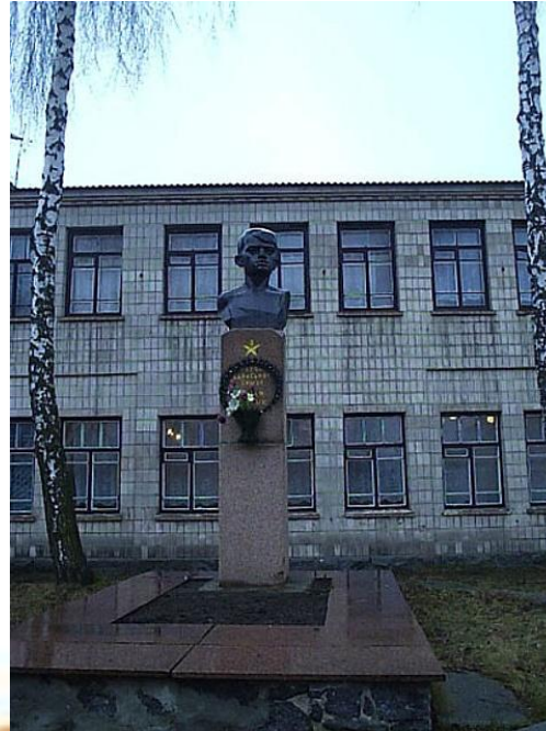
Улица В. Котика в Шепетовке