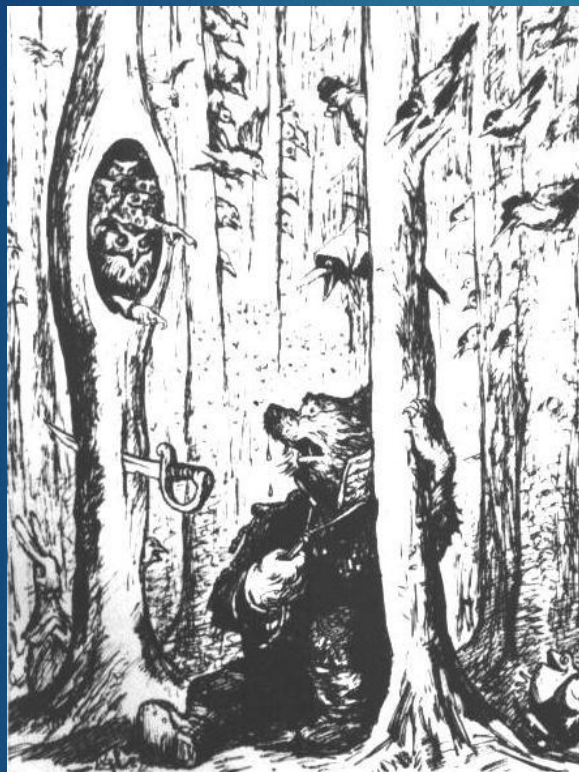
"Медведь на воеводстве"