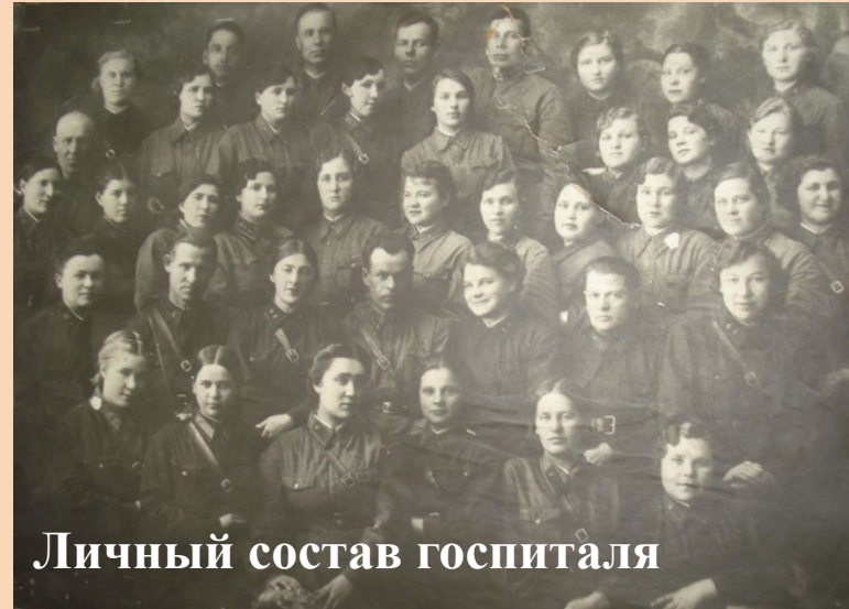
Личный состав госпиталя

Майор медицинской службы, главный врач Сараевской больницы, начальник эвакогоспиталя №3015 в Сараях, участница обороны Москвы. Награждена орденом Отечественной войны II степени, медалями «За оборону Москвы»