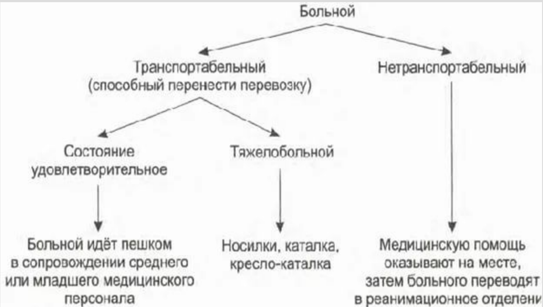
Рис. 2-6. Схема выбора способа транспортировки больного.