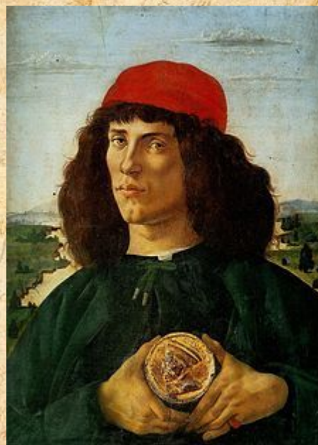
«Портрет неизвестного с медалью Козимо Медичи»