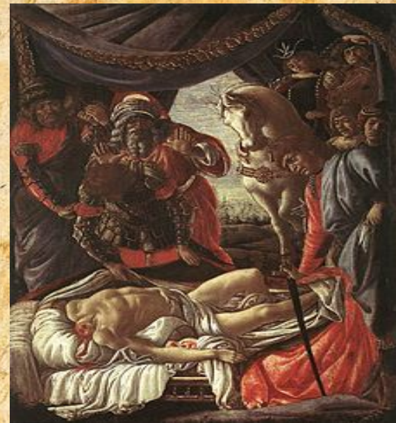
«Нахождение тела Олоферна».