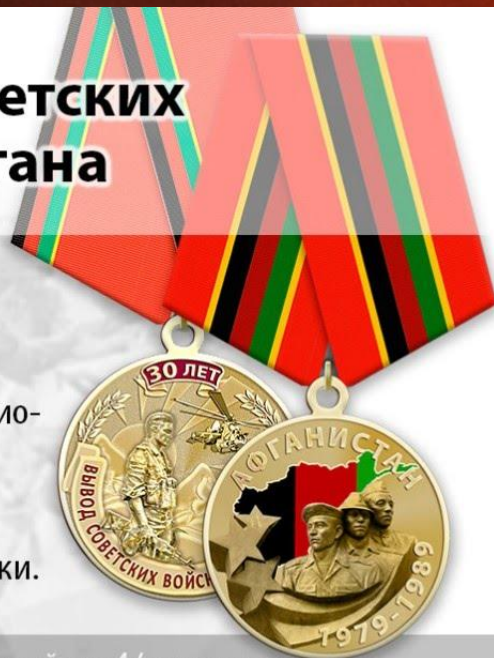
Медали «30 лет вывода советских войск из Афганистана»

Для поощрения традиционно используют памятные медали и знаки.