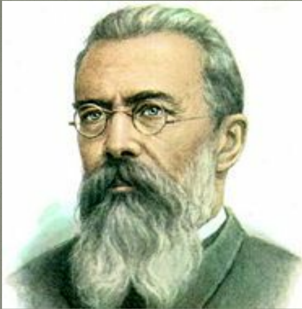
Н.А.Римский - Корсаков