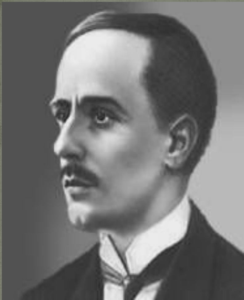
балетмейстер Михаил Фокин