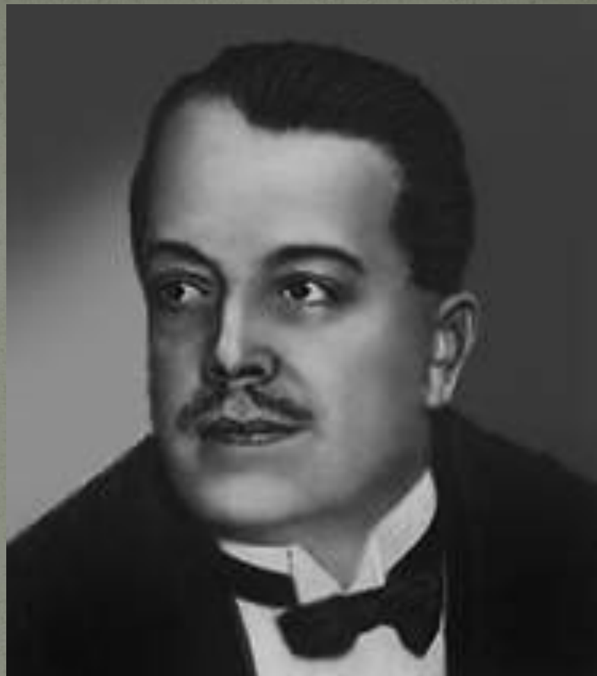
антрепренёр Сергей Дягилев