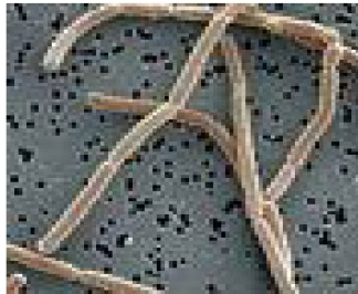
Строение молочнокислых бактерий