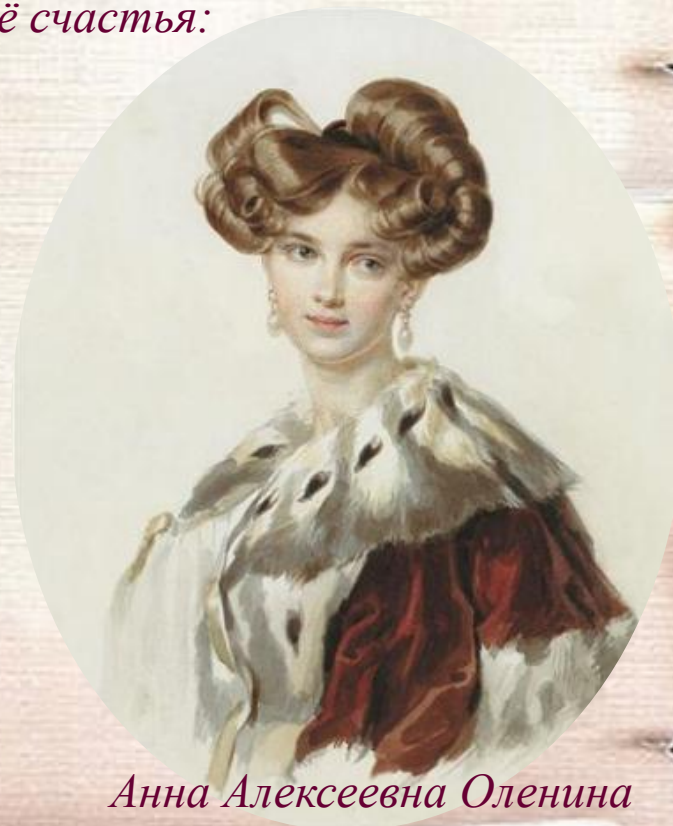
Анна Алексеевна Оленина

Я вас любил: любовь еще, быть может, В душе моей угасла не совсем; Но пусть она вас больше не тревожит; Я не хочу печалить вас ничем. Я вас любил безмолвно, безнадежно, То робостью, то ревностью томим; Я вас любил так искренно, так нежно, Как дай вам бог любимой быть другим. 1829