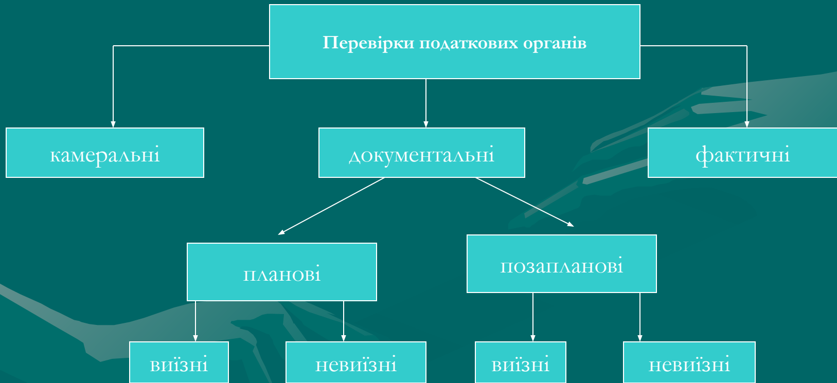
Рис. 3. Види перевірок згідно Податкового кодексу