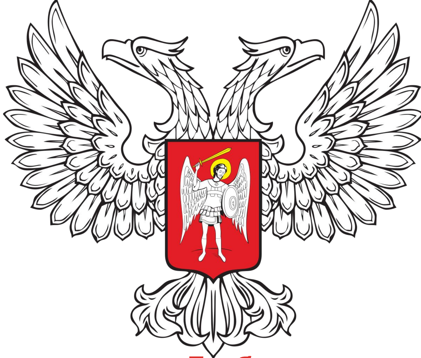
Герб Донецкой Народной Республики