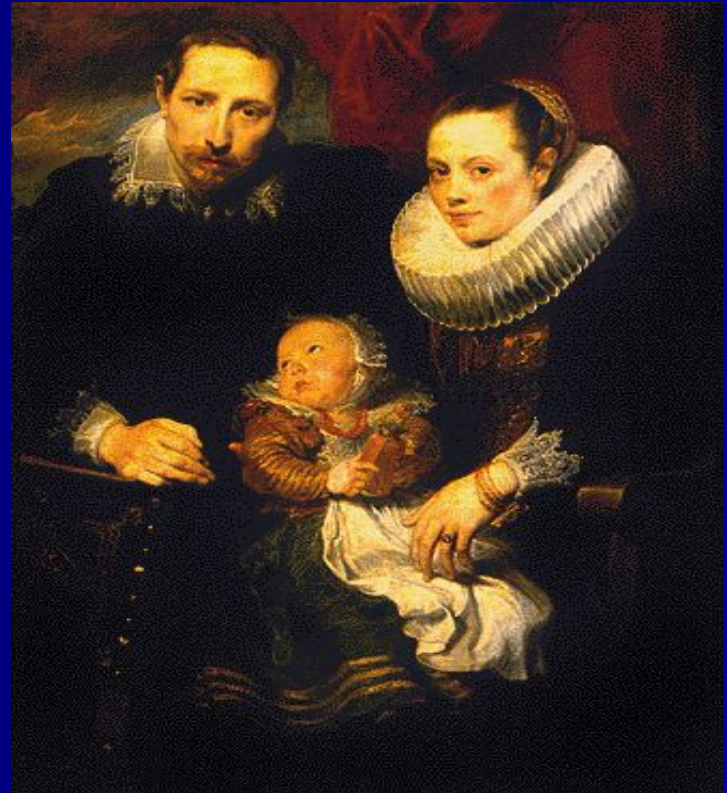
Ван Дейк «Семейный портрет»