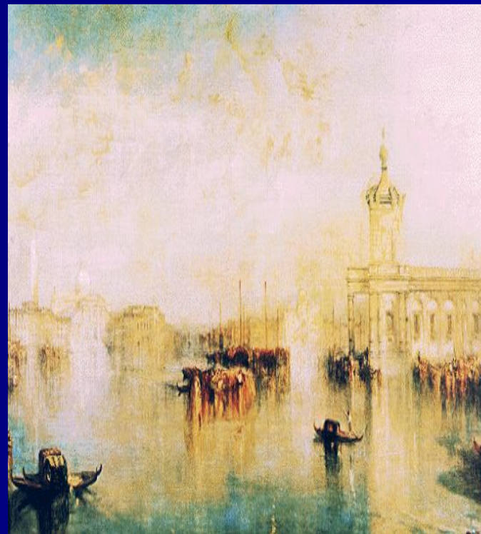
У.Тёрнер «Догана и Сан Джорджо В Венеции» ↓