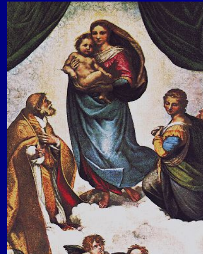
Рафаэль «Сикстинская Мадонна»