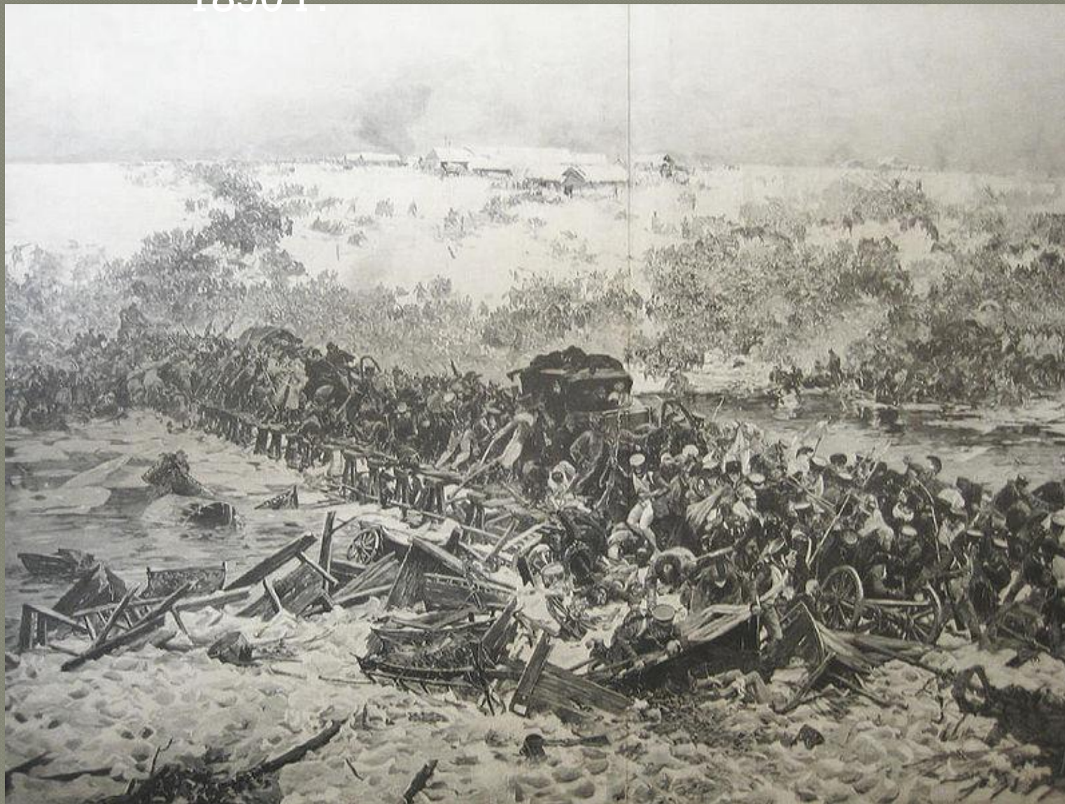
Мост через Березину. Ю. Фалат , 1890 г.