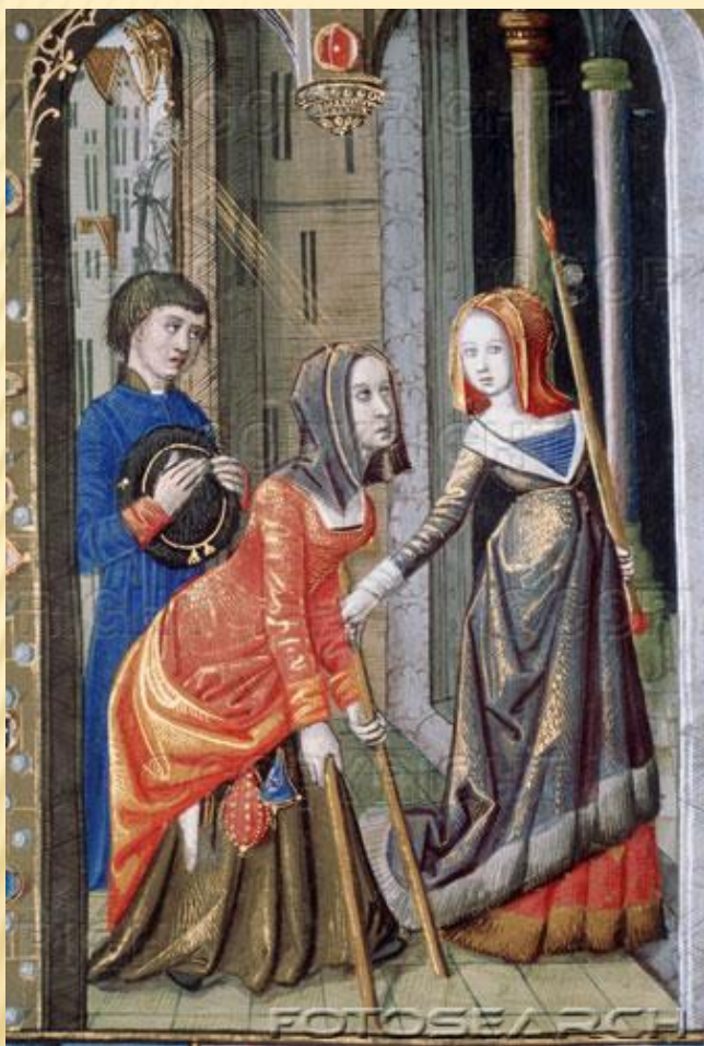
Шөһәр хатын- кызлары