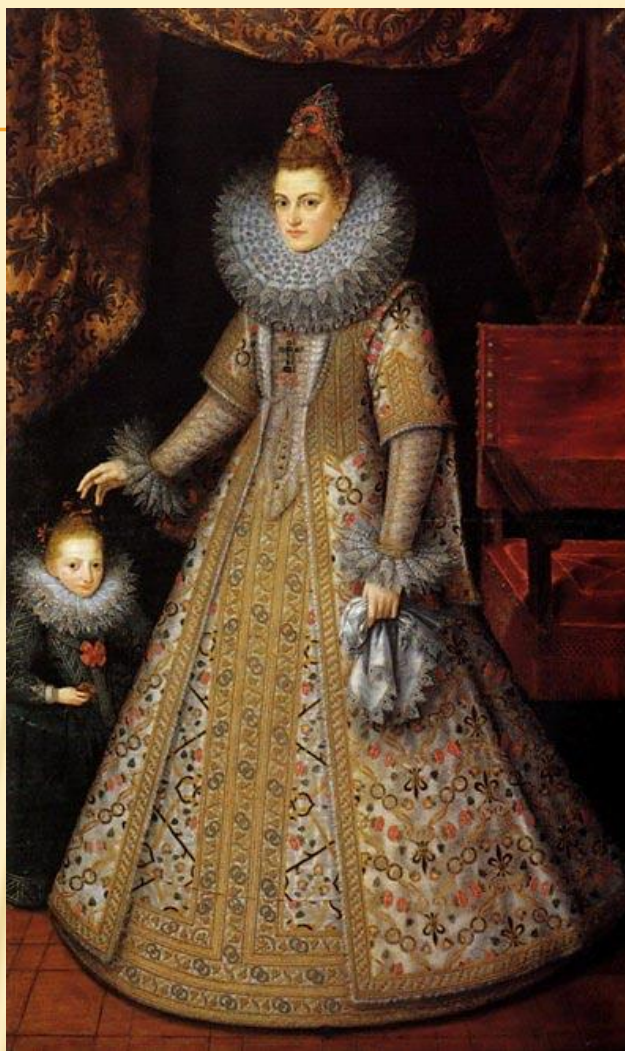
Затлы нәсел хатын- кызлары