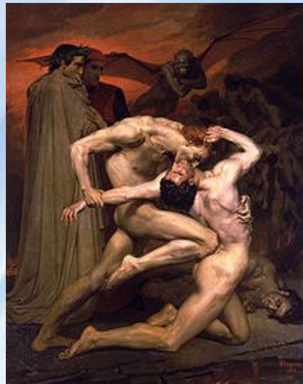
• Данте и Вергилий в аду