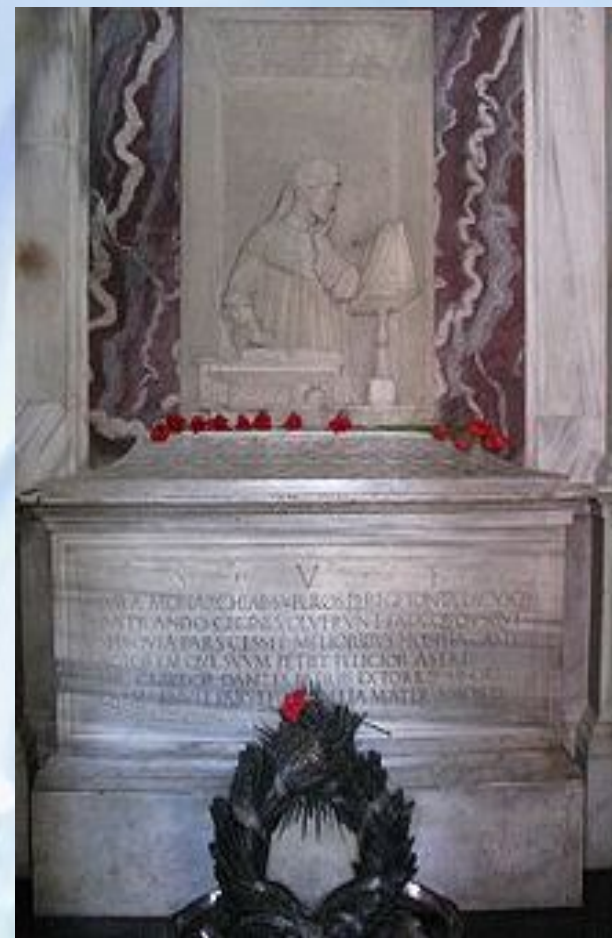
Надгробие Данте в Равенне