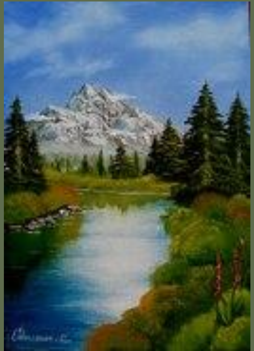
Работы, выполненные маслом.