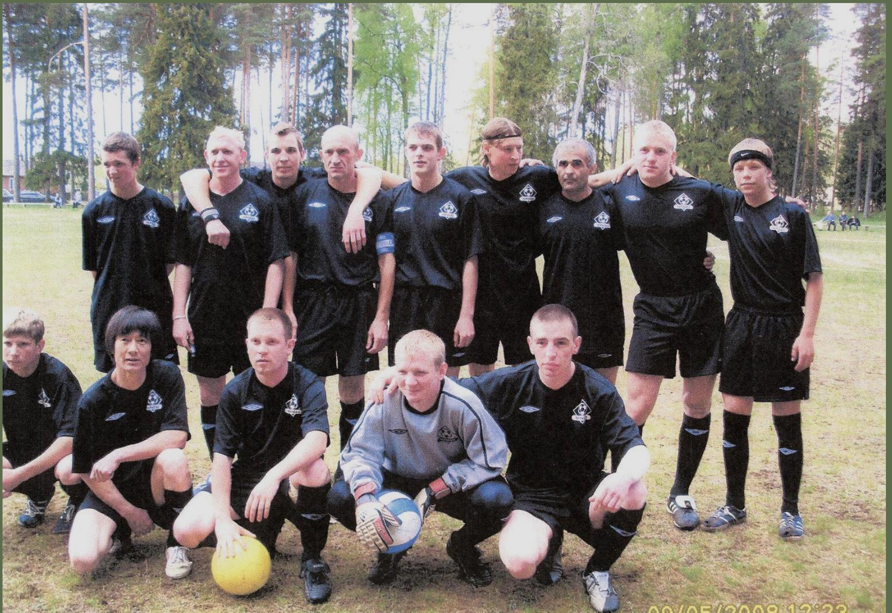
Футбольная команда «Чернево»