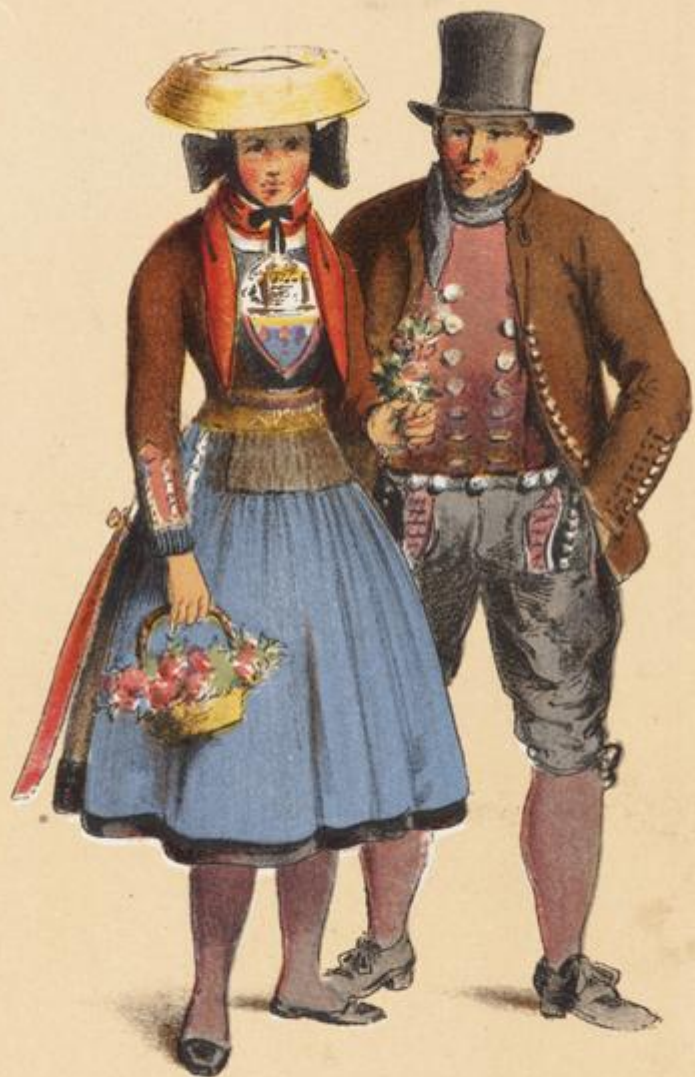
VIERLANDE near Hamburg.