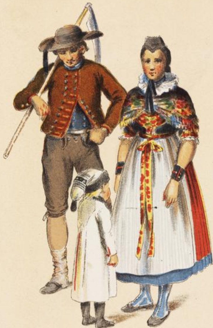
LOWER HESSE CASSEL Nerndorf.