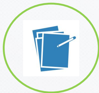
РАБОЧИЙ КОНТРАКТ+ВИЗА В ЧЕХИИ