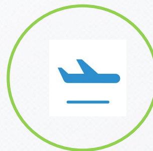
РАБОТА НА РОДИНЕ