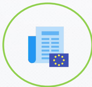
ТРУДОУСТРОЙСТВО В ЕС