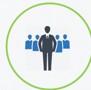
БИЗНЕС В ЕВРОПЕ