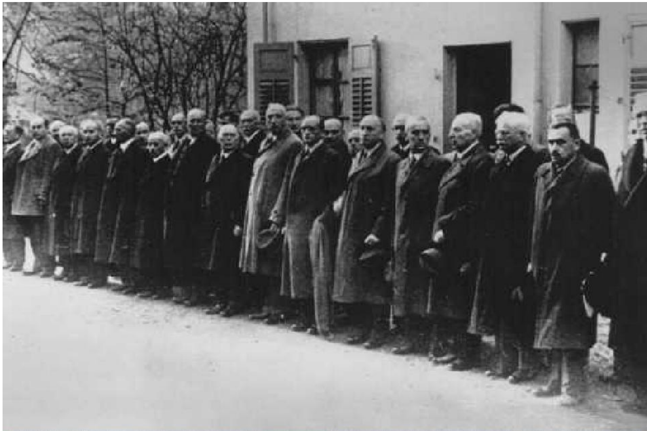
Евреи, арестованные после “Хрустальной ночи”, ожидают депортации в концентрационный лагерь Дахау. Баден-Баден, Германия, 10 ноября 1938г