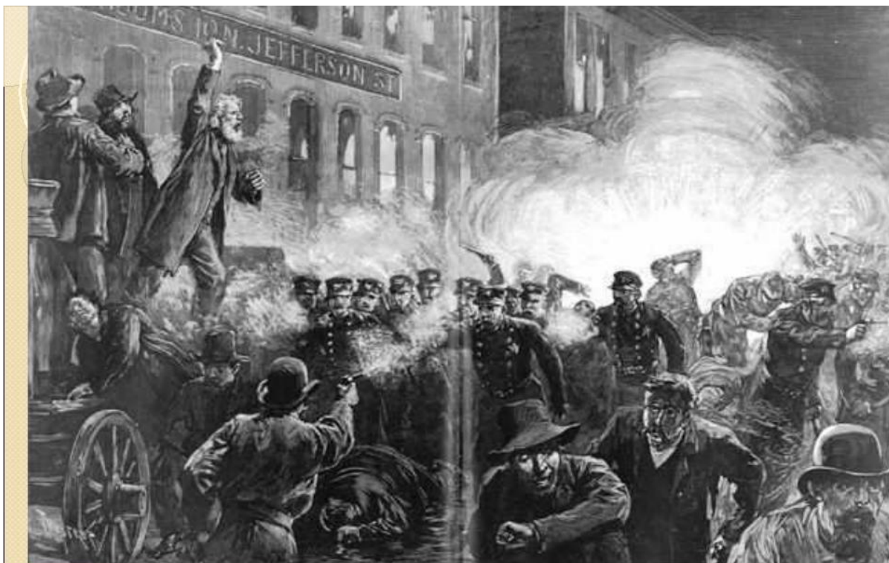
Столкновения рабочих с полицией в Чикаго, 1886