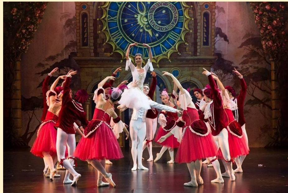
С.С. Прокофьев балет «Золушка»