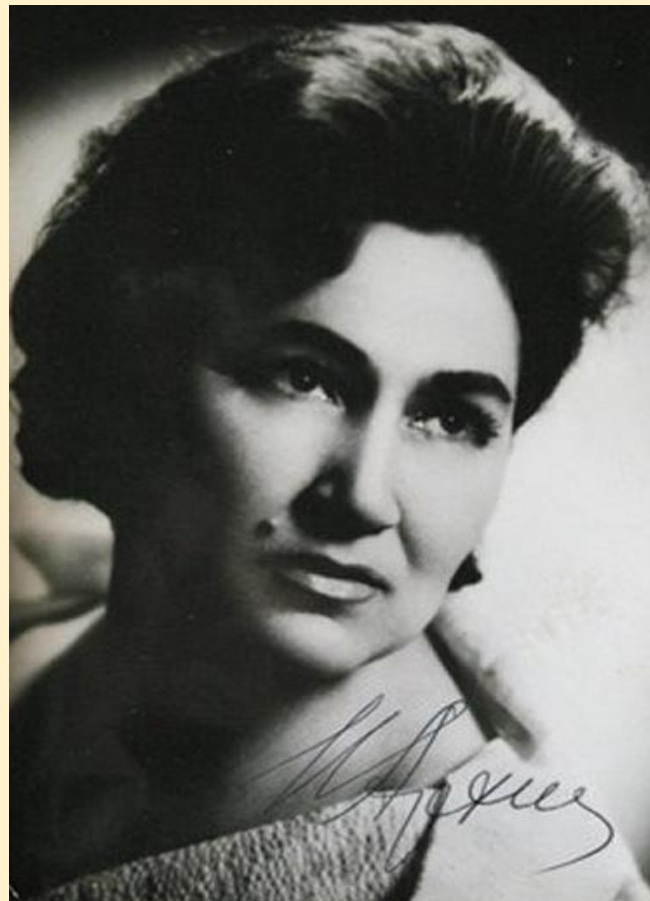
И. К. Архипова