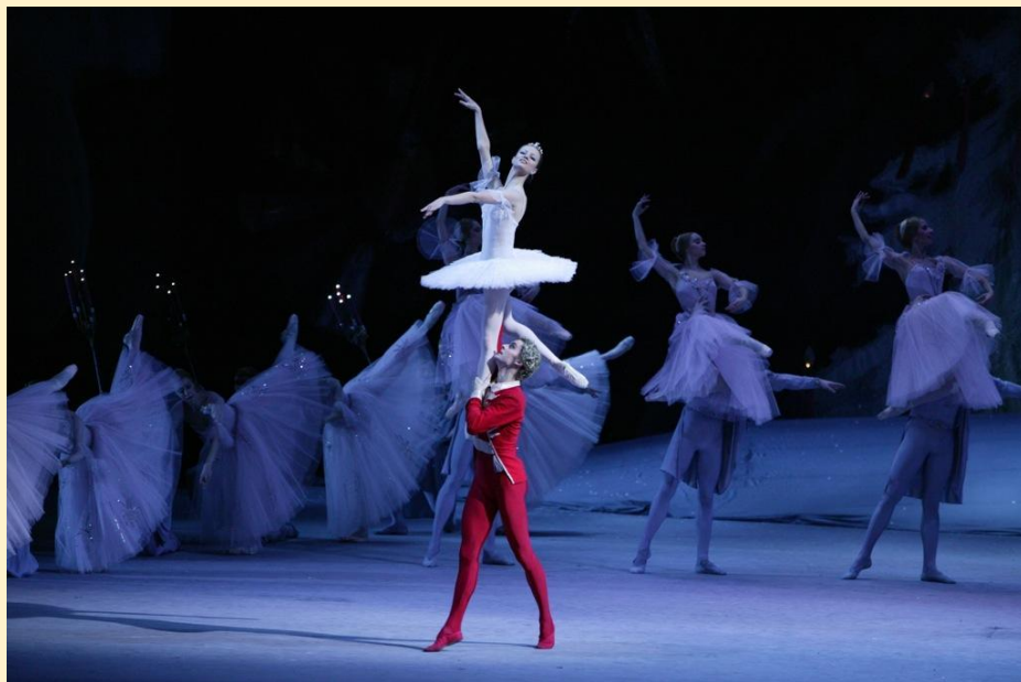
П.И. Чайковский балет «Щелкунчик»

Даже опера и балет обрели на экране как бы второе рождение. Для телеоперы, телебалета многие композиторы специально пишут музыку