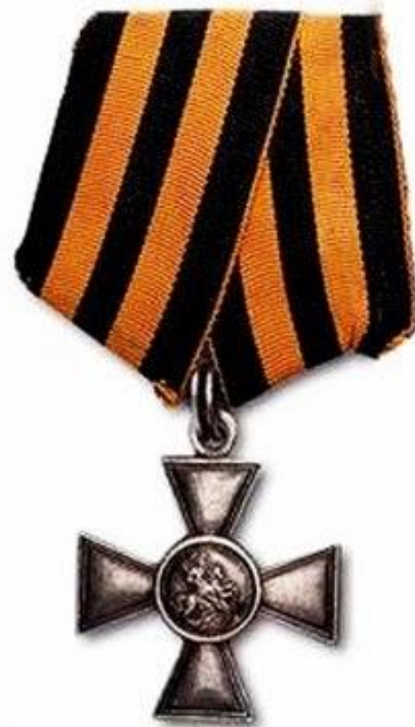
Орден Святого Георгия с Георгиевской лентой (Российская империя)

Исторически «Георгиевская ленточка» является наследницей Георгиевской ленты - двухцветной ленты к ордену Святого Георгия, Георгиевскому кресту или Георгиевской медали, которые служили военными наградами в Российской Империи.