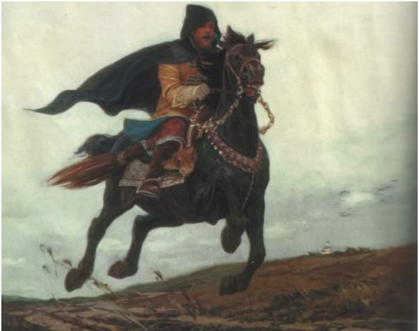
С. Ефошкин. «Опричник»