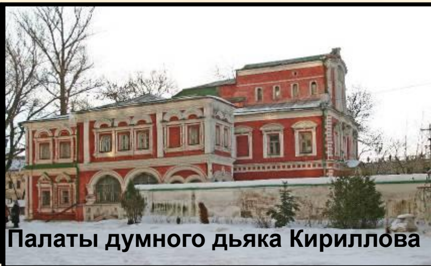
Палаты думного дьяка Кириллова