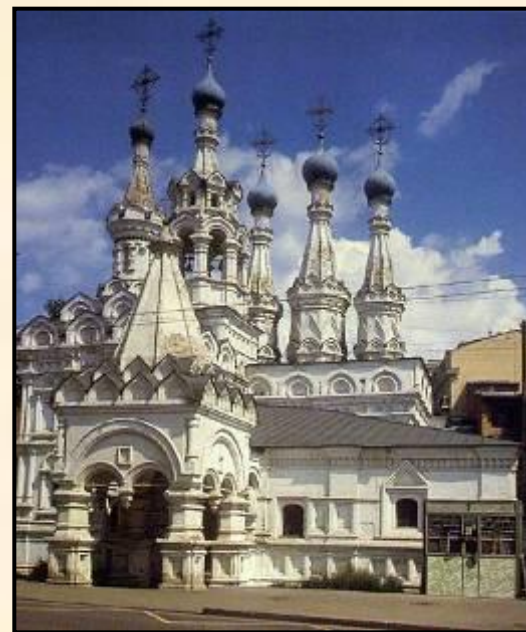
Церковь Рождества Богородицы в Путинках

1652 г. – запрет на строительство храмов шатрового стиля