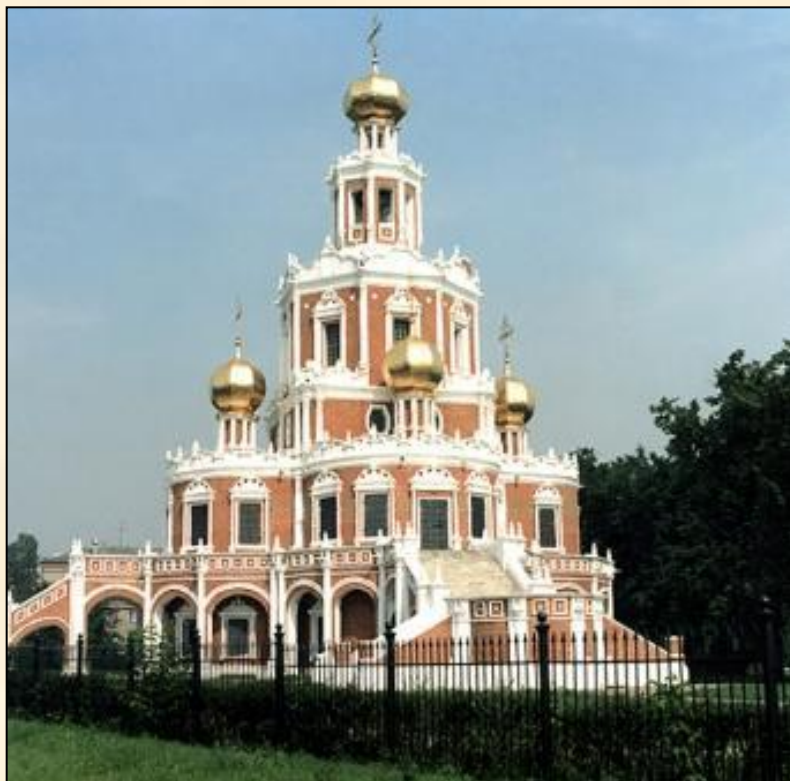
Храм Покрова Богородицы в Филях – усадебная церковь Нарышкина Л.К.

Барокко – (от ит. barocco – причудливый, вычурный) – это художественный стиль, отличающийся пышностью, причудливостью деталей.