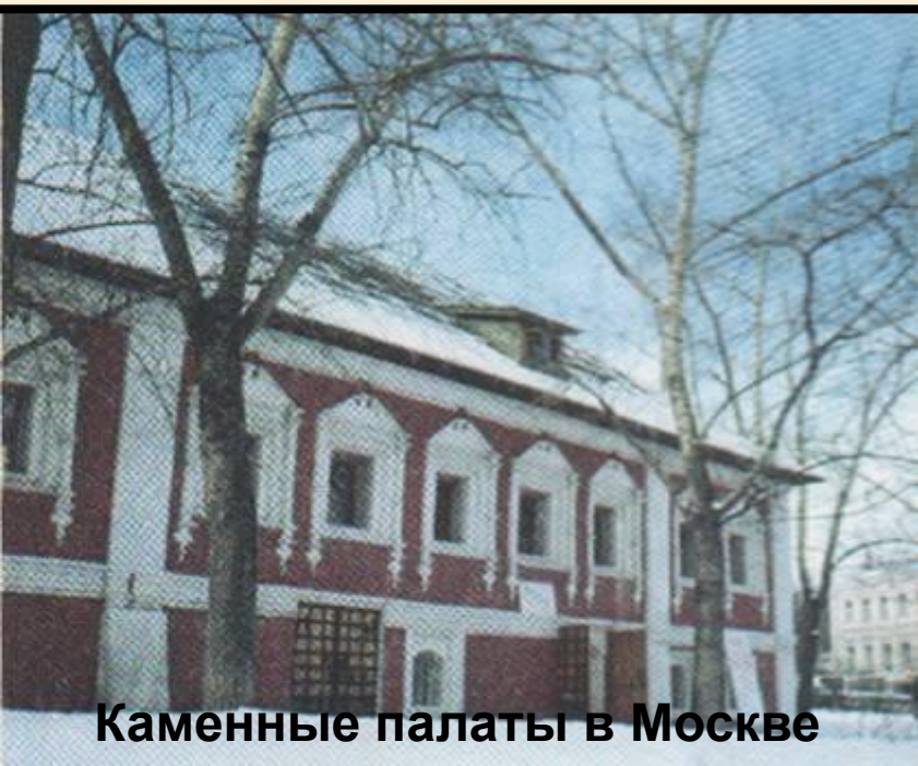
Каменные палаты в Москве