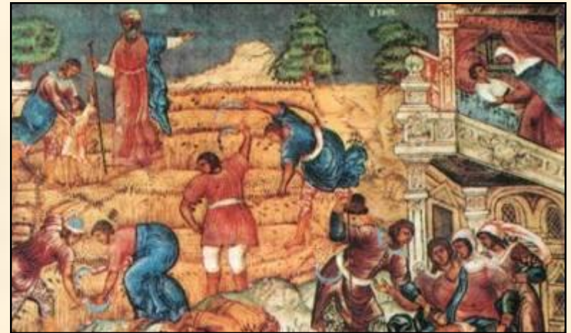
«Деяния пророка Елисея». Гурий Никитин