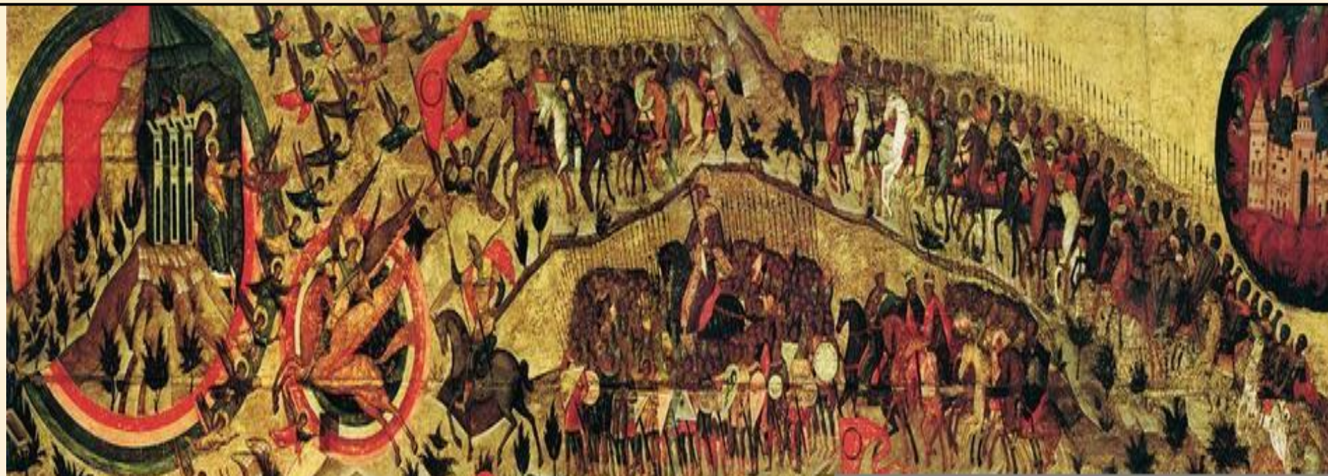
«Благословенно воинство небесного царя» («Церковь воинствующая»)