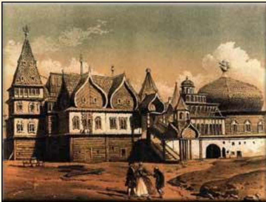
Деревянный дворец царя Алексея Михайловича в селе Коломенском