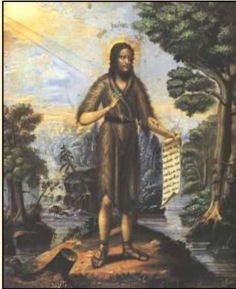
«Иоанн Предтеча в пустыне». Прокопий Чирин