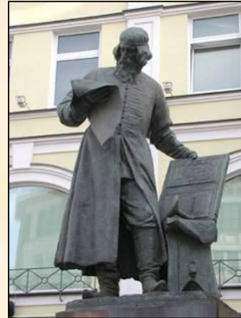
Иван Федоров (Москвитин) Петр Тимофеев Мстиславец