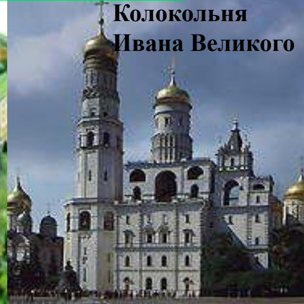
Колокольня Ивана Великого