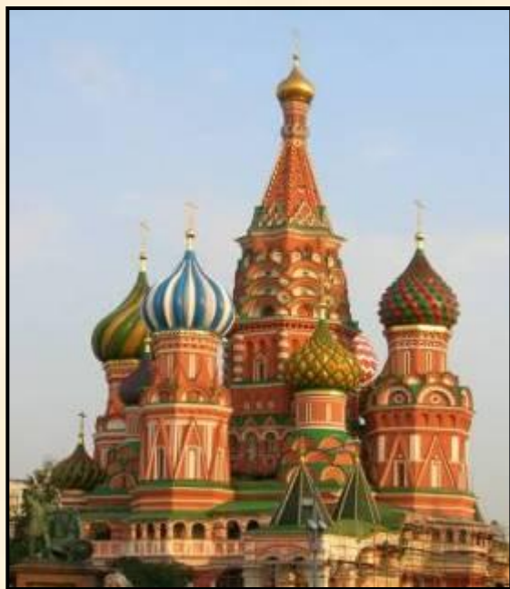
Церковь Покрова Богородицы на Красной площади