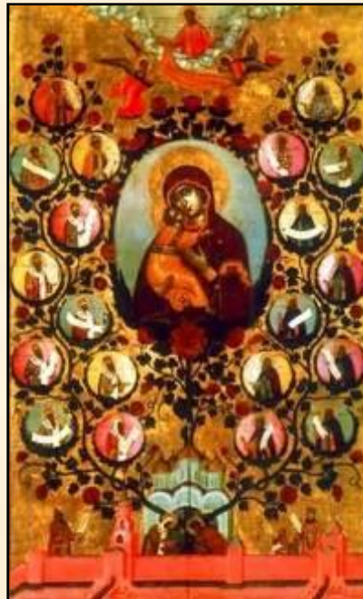
«Насаждение древа государства Российского». Симон Ушаков