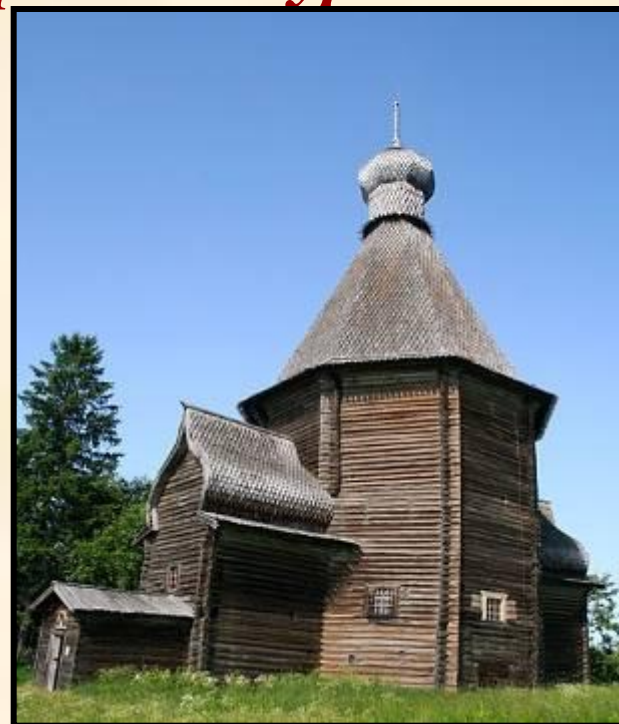
Никольская церковь в селе Лявля Архангельской области

Шатровый стиль архитектуры – вид архитектурного сооружения, завершающегося высокой многогранной пирамидой