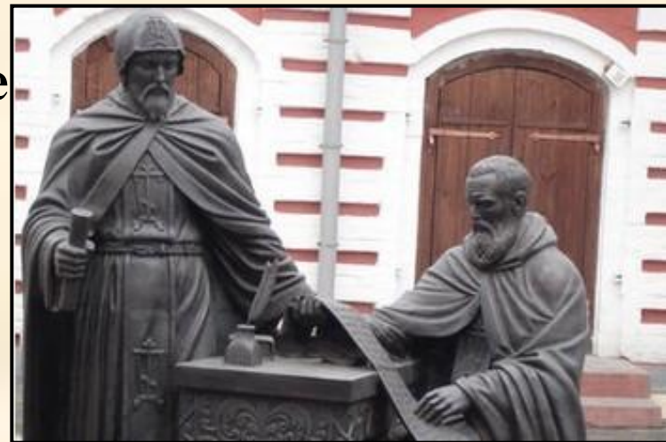
Иоанникий и Софроний Лихуды

1687 год - Славяно – греко – латинское училище