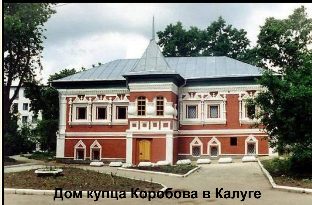
Дом купца Коробова в Калуге