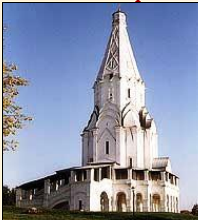
Церковь Вознесения в селе Коломенском