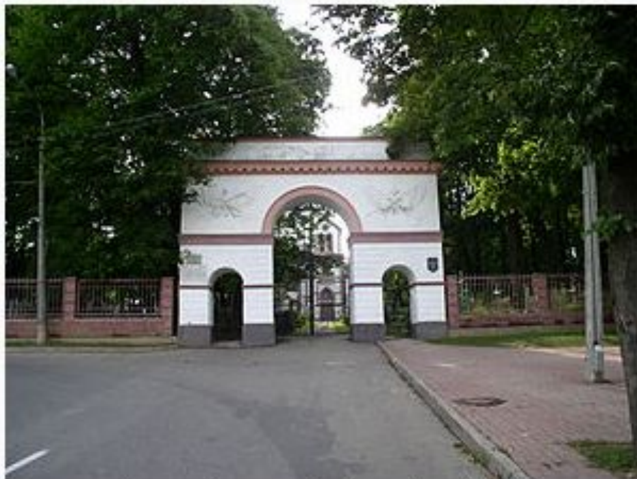
Брама Кальварыйскіх могілак (1830)