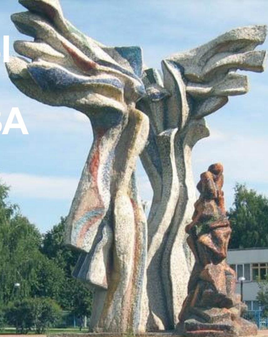
АЙГЮЛ - КИРИЛЛОВА Скульптура из мозаики, Москва 1988 г.