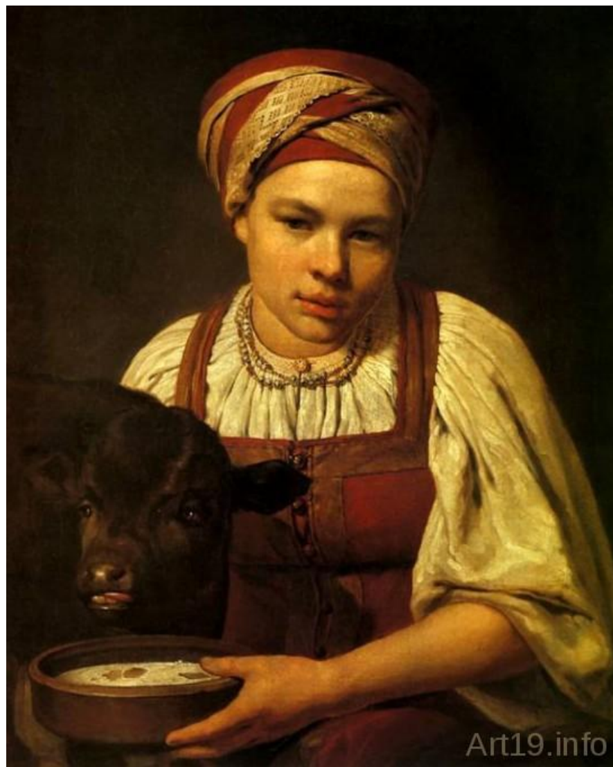
Девушка с телянком