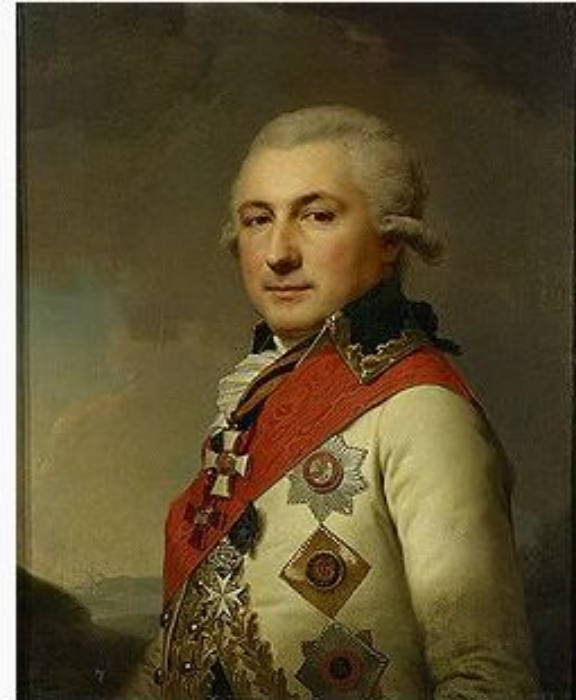
Адмирал Иосиф де Рибас