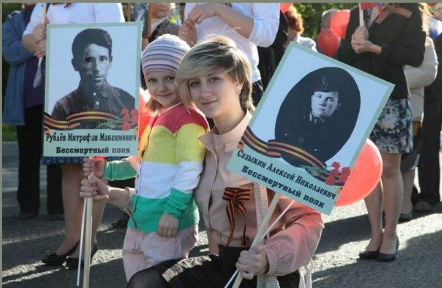
Бессмертный полк г. Задонск 2014 г. Я помню! Я горжусь!