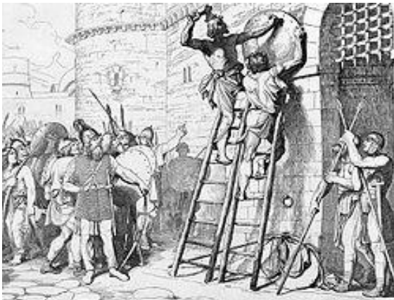
Олег прибывает щит свой к вратам Царьграда. Гравюра Ф. А. Бруни, 1839