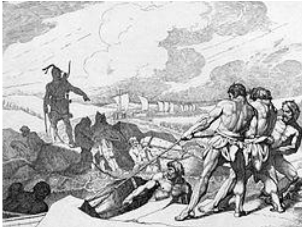
Поход Олега в Царьград. Гравюра Ф. А. Бруни, 1839