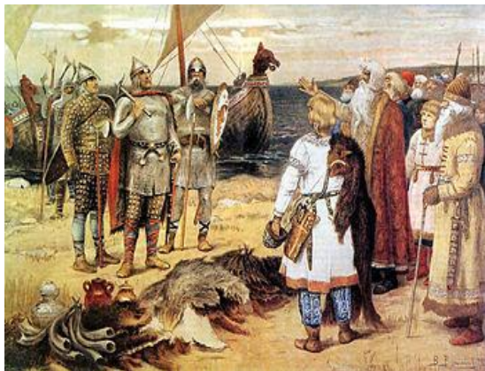
Призвание варягов. В. М. Васнецов