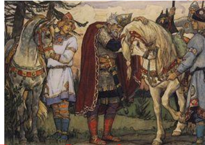
Прощание Вещего Олега с конем. В. Васнецов, 1899