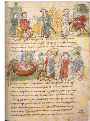
Олег показывает маленького Аскольду и Диру. Миниатюра из Радзивилловской летописи. XV в.