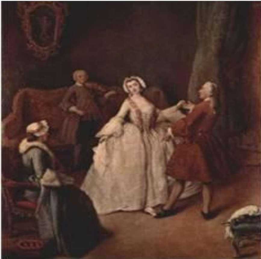
Учитель изящных манер

Бальные танцы были обязательным условием воспитания аристократии, их изучали в специальных школах, нанимали учителя танцев, преподавателя изящных манер. Они обучали манерам, этикету и тончайшим деталям поведения.