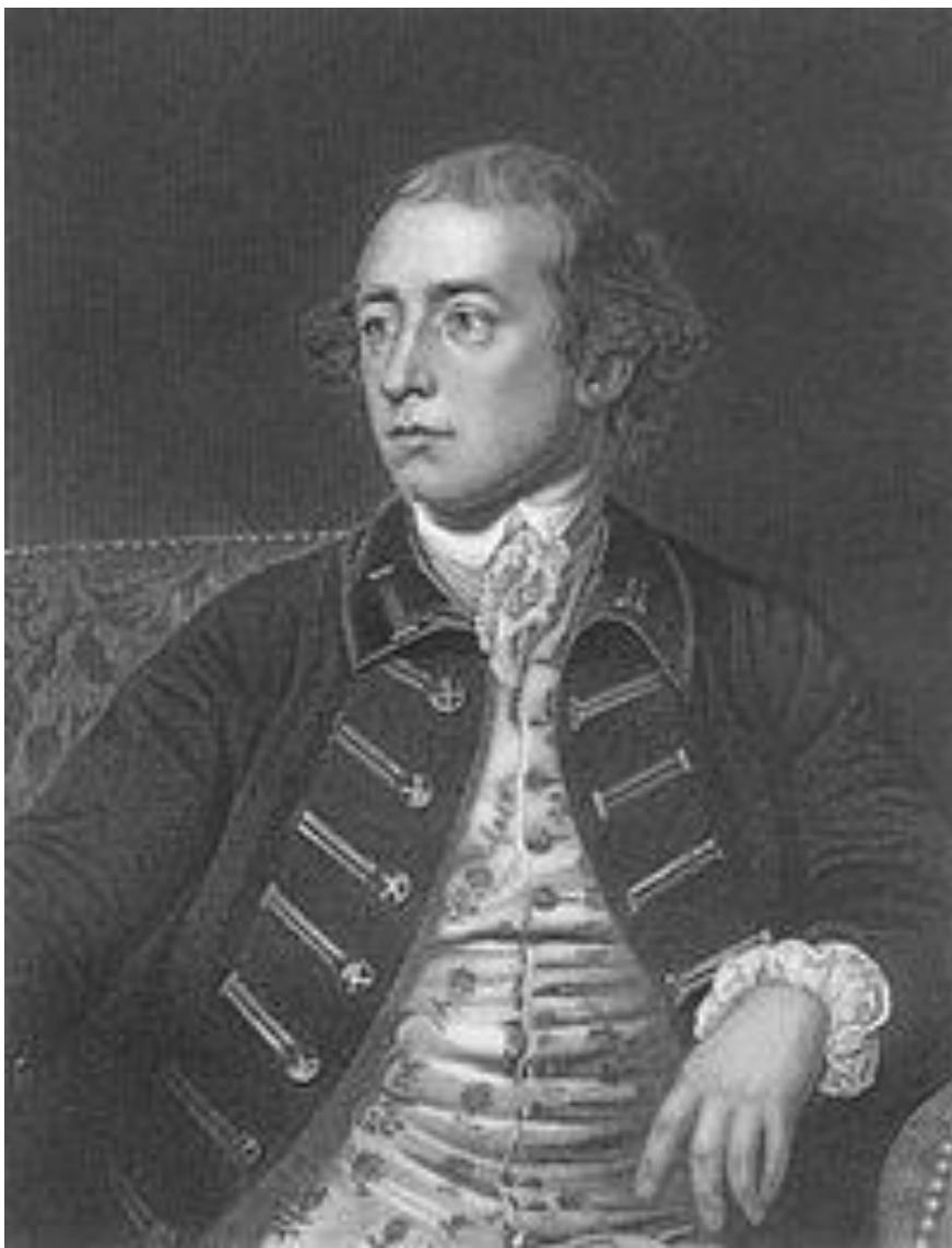
Уоррен Гастингс, 1774-1785 генерал- губернатор Индии